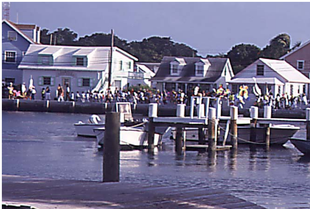
På nyårsdagen firas Junkanoo, som karneval kallas i New Plymouth och då deltar alla stadens 500 invånarna.

Huvudön Abaco är gles befolkad med stora orörda landområden beväxade med karibisk tall och längst i söder träskmarker. Marsh Harbour, öns affärscentrum,