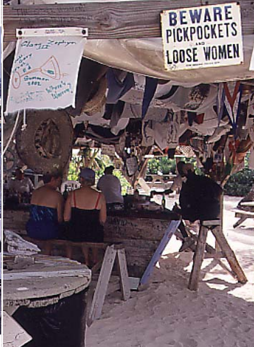
Pete's Pub ligger i Little Harbour, en sagolikt vacker vik, och är berömd för sin goda mat och sin originella inredning av vrakgods, skrot och donerade t-shirts.