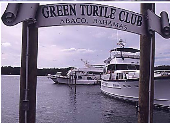
I marinan på Green Turtle Club ankrar lustyachter och segelbåtar. Sommartid är det trängsel för då anordnas fisketävlingar och regattor över hela Abaco.