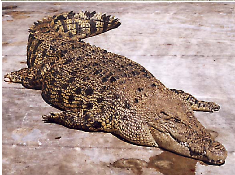
En av tusentalet krokodiler som visar upp sig på Langkawis krokodilfarm. Den här besten är drygt fem meter lång!