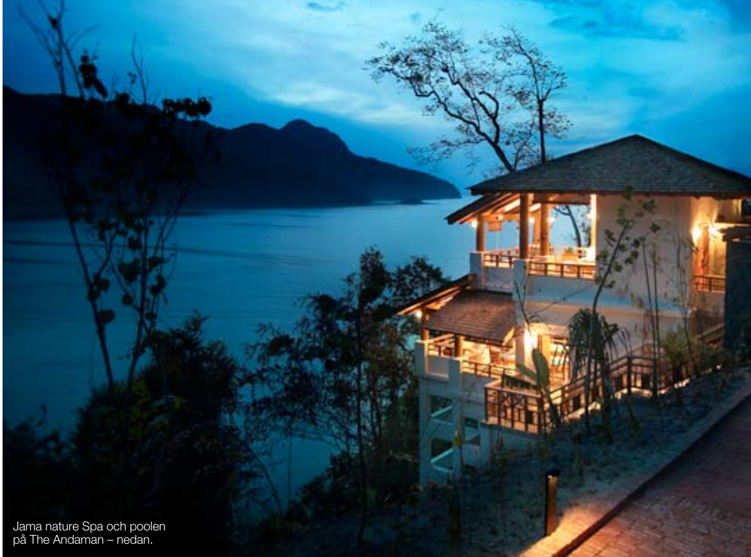
Jama nature Spa och poolen på The Andaman – nedan.