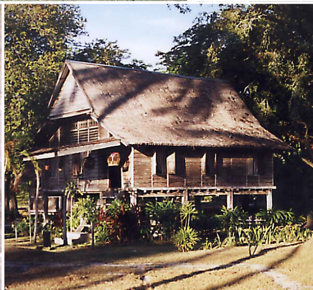
Klassisk malaysisk byggnadsstil med hus på pålar, som ger god ventilation och håller oönskade kryp borta. Det finns gott om sådana här hus på Langkawi.

► Langkawi och andra öar i ögruppen, samt grannlandet Thailand. Själva berget sägs vara det äldsta sandstensberget i hela Asien – 600 miljoner år gammalt!