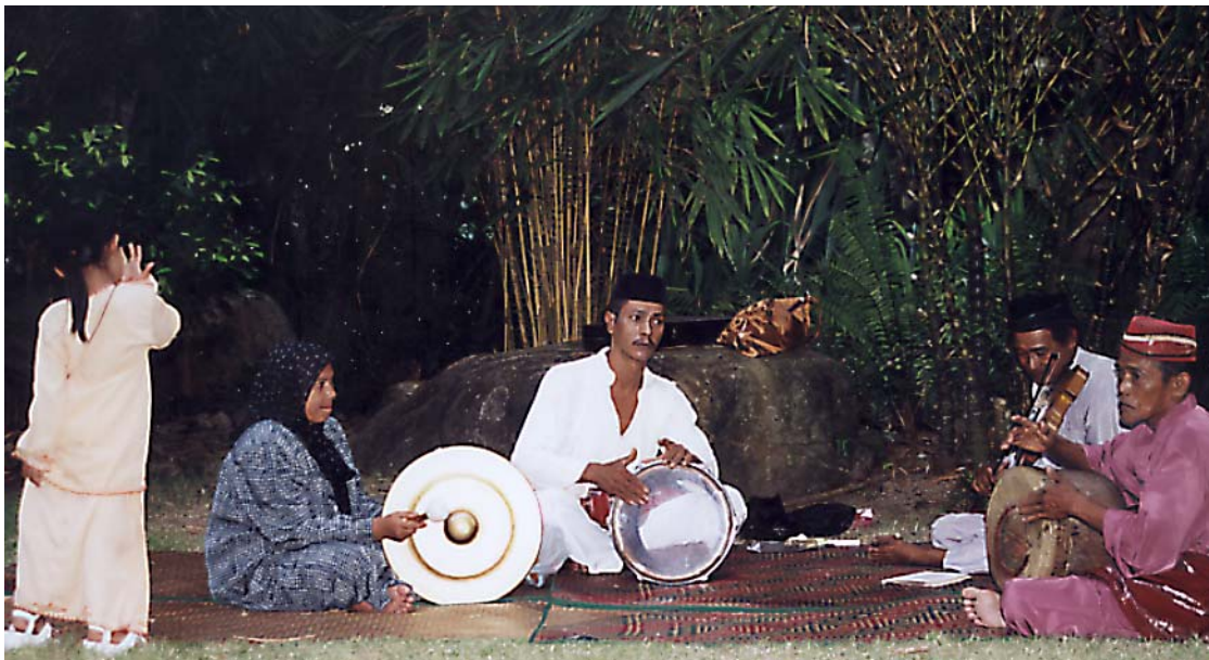
Traditionell malaysisk folklöre med sagoberättare, musiker och sångare hålls vid liv på Langkawi.