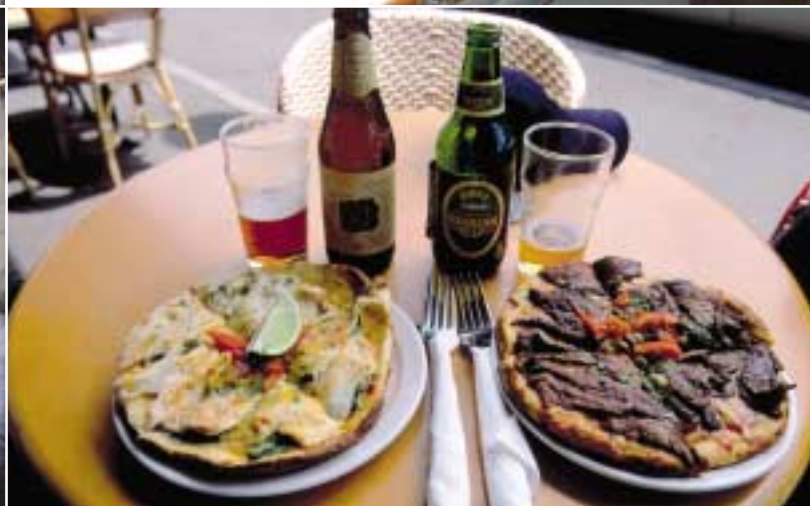
Tågets restaurang och en Kangaroo Gold-hytt, överst. Royal Flying Doctorsbas i Broken Hill, ovan till vänster. Krokodil- resp. kängurupizza i Sydney, ovan till höger.