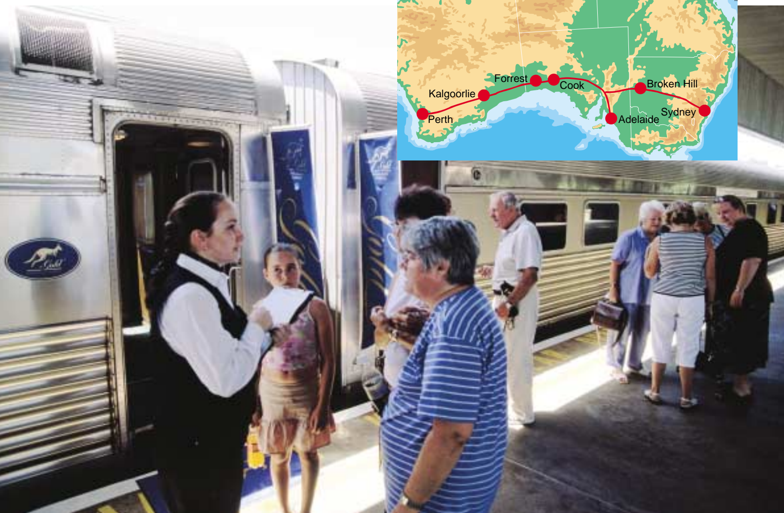
Servicenivån märks redan vid påstigningen, där passagerarna blir väl omhändertagna redan på perrongen.