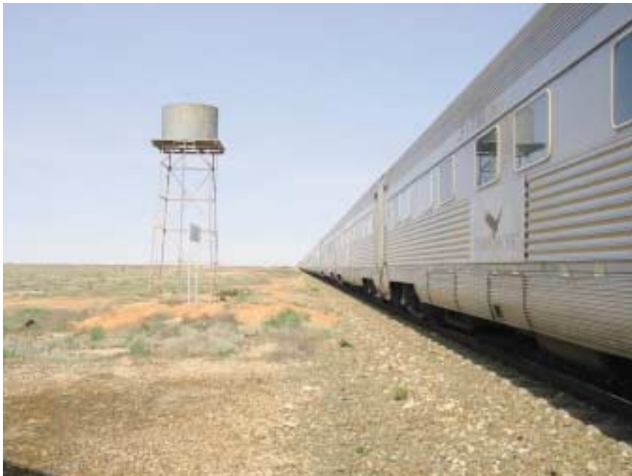
De öde byarna föddes i Landet Ingenstans som vattenstationer för ångloken.

► När vi vaknar den tredje och sista morgonen befinner vi oss i Blue Mountains på väg ner mot Sydney på Australiens östkust. Den vackra och regnskogsfuktiga bergskedjan och kanjonen bjuder på en resa i starkt kuperad terräng med många tunnlar. Det börjar vid det här laget kännas som en påfrestning att få mat tre gånger om dagen på ett tåg där man inte ägnar sig åt några andra fysiska aktiviteter än promenaderna till just restaurangvagnen. Efter en sista frukostsittning når vi Sydney klockan 09:15 efter en knappt tre dygn lång resa.