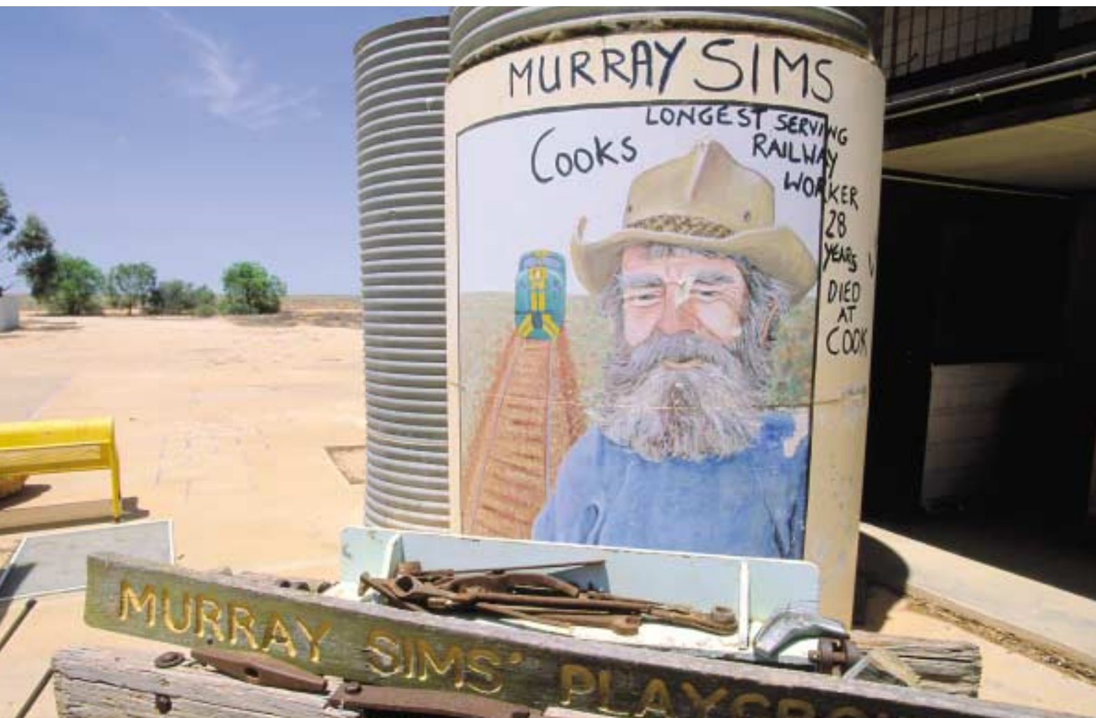
Cook Town, den en gång blomstrande järnvägsorten mitt på Nullarbor Plain, är idag en spökstad bränd av den obarmhärtiga solen.

”Här ute i vildmarken stannar det långa tåget sina sjutton vagnar ibland i de små byar som finns kvar utmed järnvägen, tillkomna som vattenstationer under ångloksepokan.”