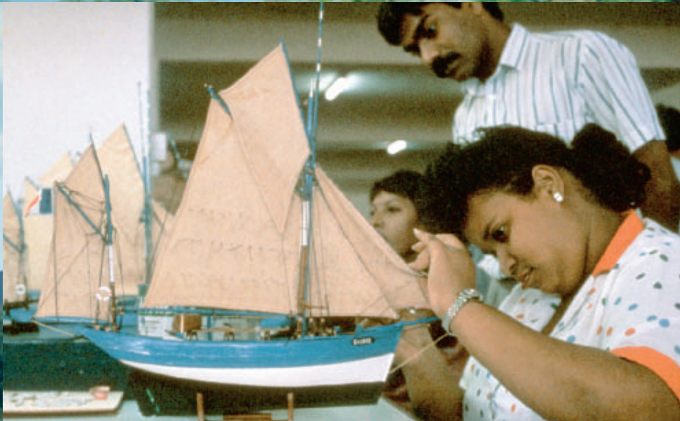
Båtmodeller är populära souvenirer på Mauritius

beundra. En del besökare ger sig ut på djuphavsfiske över dagen, andra nöjer sig med att få havets delikatesser serverade på middagsbordet. Och man kan sannerligen äta gott på Mauritius många lukulliska hotellrestauranger. Seafood är förstås en specialitet för de flesta av dem.