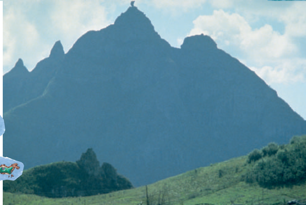
På Mauritius finns många imponerande bergstoppar som vittnar om ett vulkaniskt ursprung.