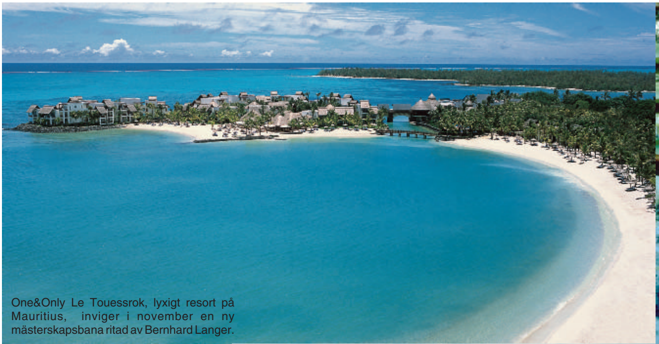
One&Only Le Touessrok, lyxigt resort på Mauritius, inviger i november en ny mästerskapsbana ritad av Bernhard Langer.