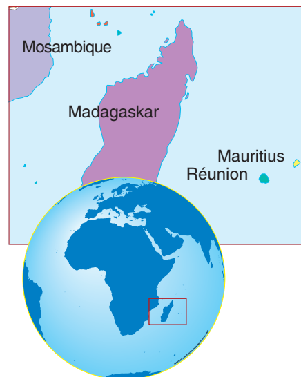
Mauritius ligger i Indiska oceanen ca 800 km öster om Madagaskar.

Med sina 333 rum är Le Coco Beach Resort det största hotellet i kedjan med fyra olika stränder att välja mellan. Massor av aktiviteter för barn gör det till ett idealiskt resort för barnfamiljer. □