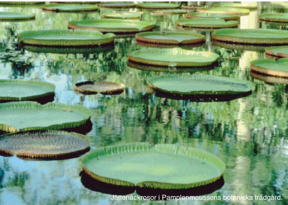
Jättenäckrosor i Pamplennoussens botaniska trädgård.