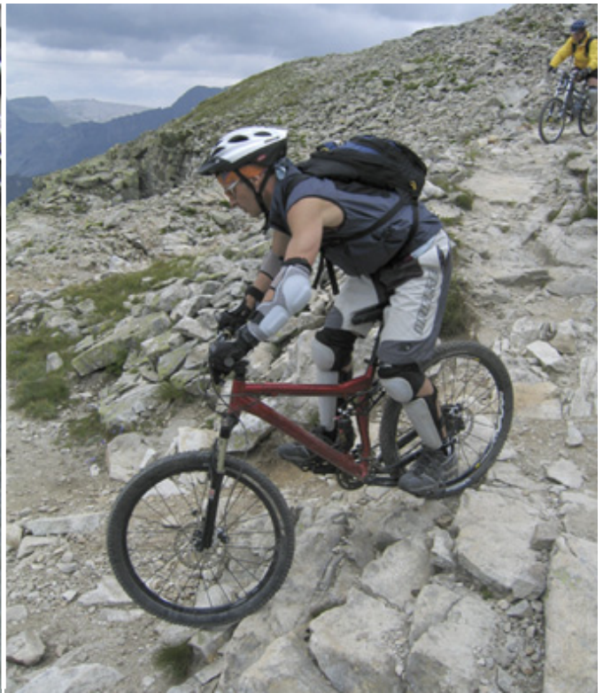
Mountainbikare gillar också Tour du Mont Blanc.

ziska delen av TMB är betydligt tamare till karaktären än den italienska, åtminstone känns det så på nästa etapp då man kan flanera genom tät skog i Val Ferrat bort till den mysiga kurorten Champex där en alpsjö lockar till ett svalkande bad. Men därefter stegrar sig landskapet till ett nytt crescendo, och till vår lycka också vädret. Vi väljer att gå det höglänta alternativet över passet Fenetre d'Arpette. Lämmeltåget har vaknat till liv igen och i den väldigt branta sista backen upp till passet, som bildar ett hack i bergskammen, får vi köa lite. Men stämningen är på topp där en liten folksamling trängs mellan klippblock och stup. Lika brant är det inledningsvis på andra sidan, och därefter blir leden en långsträckt nedförbacke parallellt med den skinande ljusa och kaotiskt uppspruckna Trientglaciären.