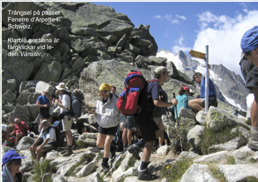
Trängsel på passet Fenetre d'Arpette i Schweiz.