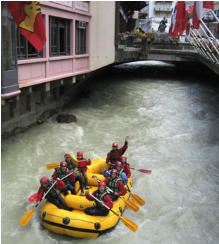
Chamonix är en av världens mest besökta turistorter, här flottar man på floden Arv genom staden.