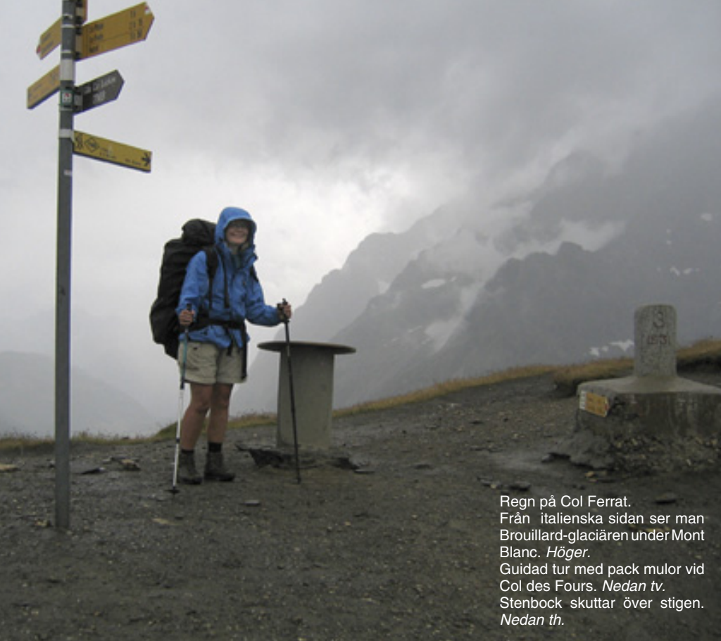
Regn på Col Ferrat. Från italienska sidan ser man Brouillard-glaciären under Mont Blanc. Höger. Guidad tur med pack mulor vid Col des Fours. Nedan tv. Stenbock skuttar över stigen. Nedan th.