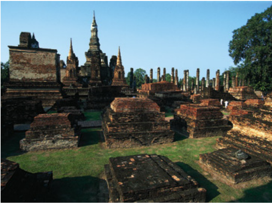
Wat Mahathat är den viktigaste tempelplatsen innanför de 800-åriga stadsmurarna som var det gamla Sukhothai, Thailands vaggas.

► ter” i fjärran land. Khmerfolket hade aldrig glömt sitt Angkor sedan de blev nedsabla av siameserna 1431, utan har nyttjat det för tillbedjan och andakt både före och under fransmännens styre i Indokina.