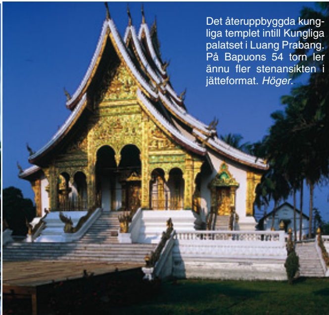
Det återupbyggda kungliga templet intill Kungliga palatset i Luang Prabang. På Bapuons 54 torn ler ännu fler stenansikten i jätteformat. Höger.