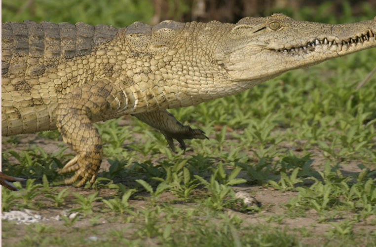
Djur med spring i benen: nilkrokodil, impalaantilop, gepard och giraff.