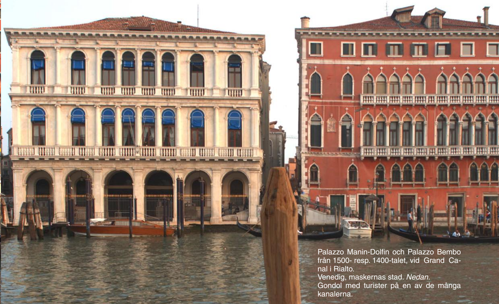
Palazzo Manin-Dolfin och Palazzo Bembo från 1500- resp. 1400-talet, vid Grand Canal i Rialto. Venedig, maskernas stad. Nedan. Gondol med turister på en av de många kanalerna.