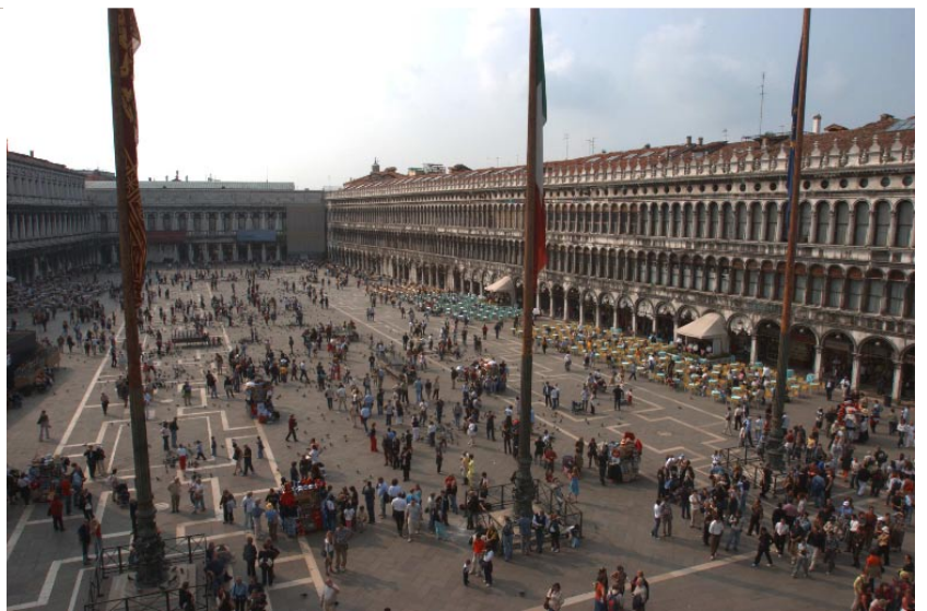
Den enorma Markusplatsen, Piazza San Marco, från Markuskyrkans övre plan. Höger.

▷ är i alla fall en osannolik skapelse, ett skrytbygge av fulländad skönhet. Frontfasadens bibliska mosaiker glimmar som guld i kvällssolen, och hela komplexet kröns av fem kupoler. Lärjungen Markus kvarlevor skulle förvaras här, det var därför jättekyrkan byggdes på 1000-talet. Men den överdrivna storleken var också en maktsymbol för dogen, Venedigs kung, som använde den som privat kapell i 700 år. Den byggdes alldeles bakom Dogepalatset, och dogen kunde lätt släntra in i sin jättekyrka från sitt jättepalats för att be om syndernas förlåtelse, så fort samvetet blev för tungt.