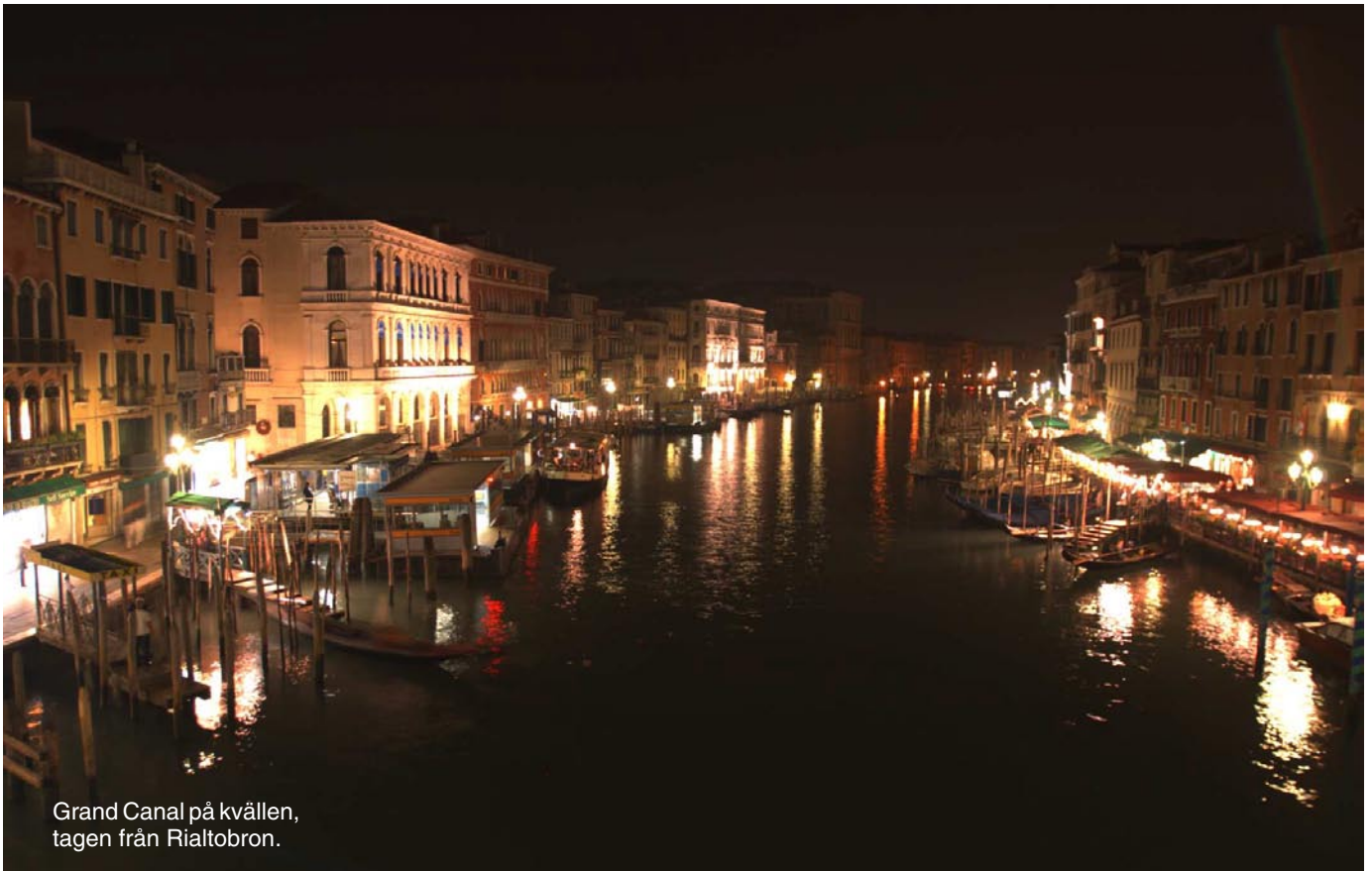
Grand Canal på kvällen, tagen från Rialtobron.