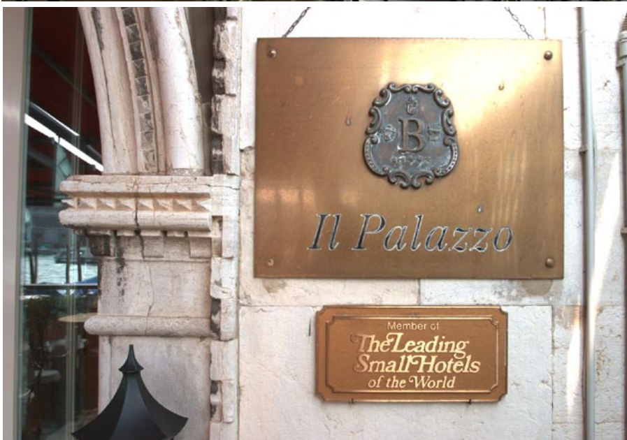
Bauer Il Palazzo vid Grand Canals mynning har gjorts om från privatpalats till palats-hotell med privat atmosfär. Den gamla 1700-talsfasaden (överst). Terrassen vid Grand Canal med utsikt mot Santa Maria della Salute (mitten). Bauers emblem vid entrén (nederst).