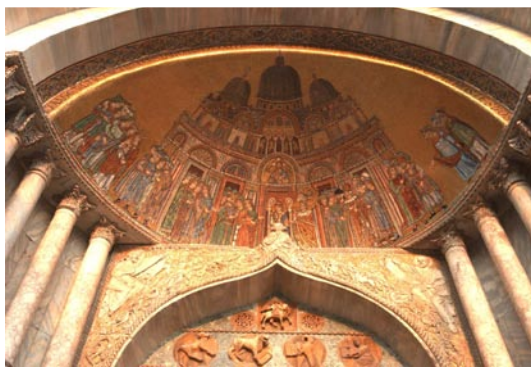
Porta di Sant'Alipio är Markuskyrkans enda port som har kvar sin ursprungliga mosaik. Den visar kyrkan före de gotiska tillskotten på fasaden. Ovan.