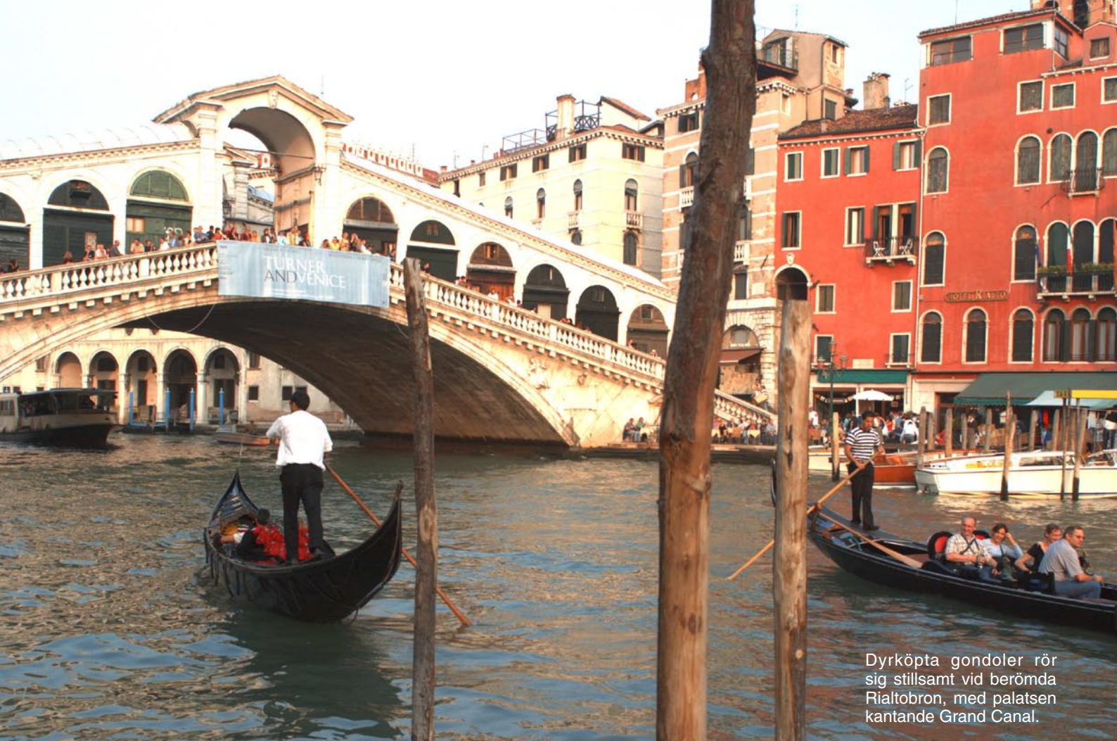
Dyrköpta gondoler rör sig stillsamt vid berömda Rialtobron, med palatsen kantande Grand Canal.