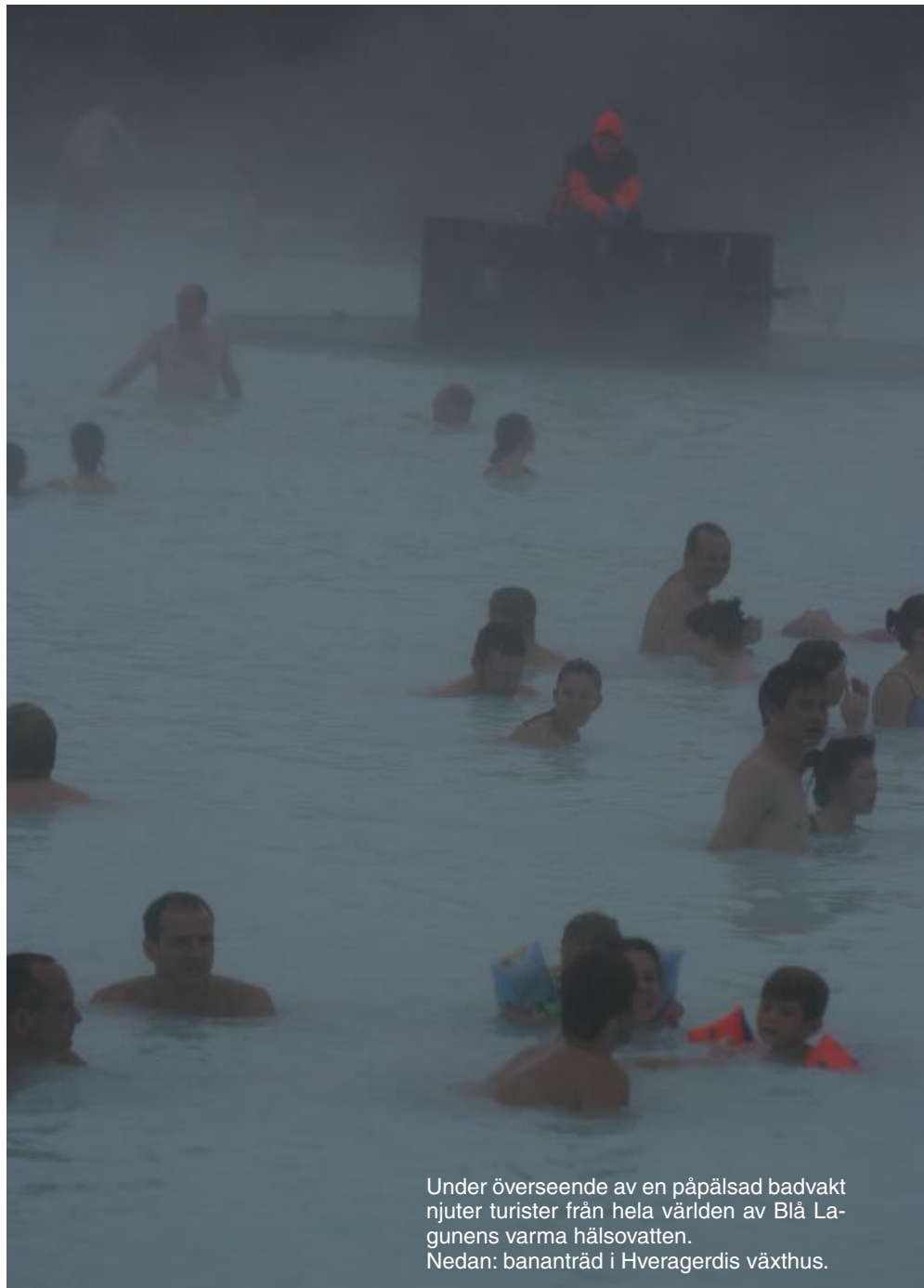
Under överseende av en påpälsad badvakt njuter turister från hela världen av Blå Lagunens varma hälsovatten. Nedan: bananträd i Hveragerdis växthus.

Icelandair förmedlar bilhyrning via Hertz och dagsutflykter genom Icelandair Holidays , när man beställer