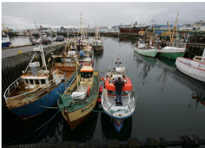
Fiskebåtarna ligger för kaj i Reykjavíks hamn.

nu som enda bolag upp till sju dagar utan något påslag på USA-biljetten. Biljetten har fått ett passande namn: ”take a break”.