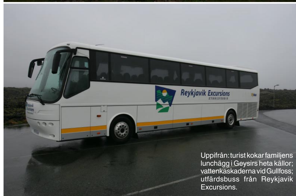
Uppifrån: turist kokar familjens lunch i Geysirs heta källor; vattenkaskaderna vid Gullfoss; utfärdsbuss från Reykjavik Excursions.

biljetter. Liksom allt på Island är även bilhyrning kostsamt. En liten 4WD Suzuki Jimny kostar 1 800 kronor per dygn inkl. allt. Minsta bilen är Toyota Yaris. Hertz är praktiskt då de har kontor på Keflaviks flygplats. En halvdagsutflykt (finns även kväll) på fyra timmar till Blue Lagoon kostar 300–430 kronor. Allt finns på flygbolagets hemsida.