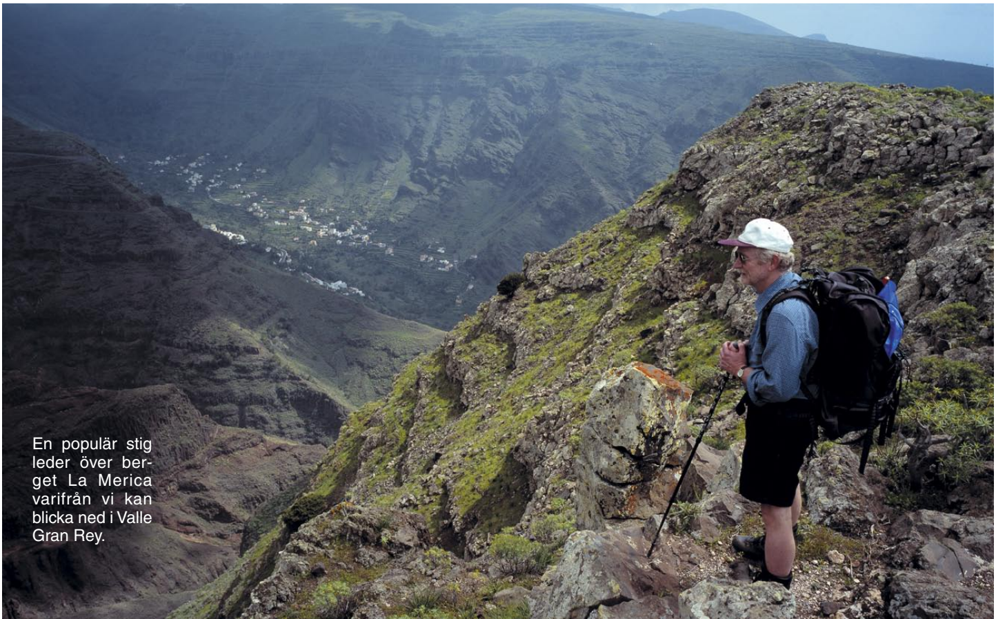
En populär stig leder över berget La Merica varifrån vi kan blicka ned i Valle Gran Rey.