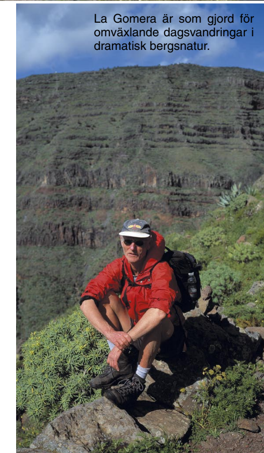
La Gomera är som gjord för omväxlande dagsvandringar i dramatisk bergsnatur.

jordskorpan. Magman trängde upp ur havet för 5 miljoner år sedan och byggde en vulkan som sedan slocknade. Ön är den enda i ögruppen som inte haft ett utbrott på mycket länge. Rinnande vatten har klöst ut de 800 meter djupa ravindalarna. Från mitten strålar dessa, och bergsryggarna mellan dem, ut mot havet, som ekrar i ett hjul. Gomera har förlänats ett spektakulärt landskap blivit en drömvärld för vandrare. Eller snarare flanörer, för här gör man inga långa färder. Normalt bor man på hotell och går på dagstur. Ön är blott två mil i diameter och har endast 16 000 bofasta. Bara en bråkdel av alla semesterfirare som reser till Kanarieöarna, hittar hit. De flesta är tyskar. Det var tyska hippies som upptäckte Valle Gran Rey i slutet på 1960-talet, och de kom för att röka gräs och lyssna till musik. Med sina tält la de beslag på en playa, "Schweinebuchte", en bit bortom Vuelta, den tredje byn vid ravinens mynning. I dag går det lugnare till. Vi ser bara enstaka fossil från flowerpower-tiden, och solbadarna är inte så många. Stränderna har mycket sten. En nimbus av jungfrulighet vilar över La Gomera, och myndigheterna vill helst ha det så, och vidmakthålla en diskret och uthållig turism. Det gör ön till ett perfekt resmål för backpackers.