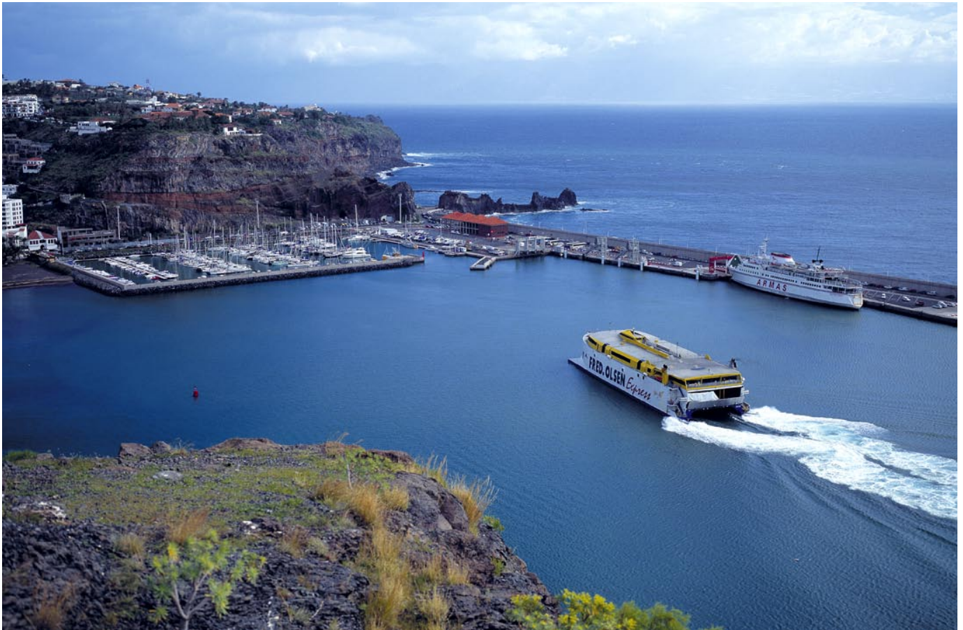
Den väldiga katamaranen från Teneriffa anlöper hamnen i San Sebastian.

► hans telefon. Vi råds lämna in mobilen i baren "Maria" som drivs av kvinnans man. Där mottas vi som vardagshjältar och blir bjudna på öl innan en taxi för oss tillbaka till La Playa.