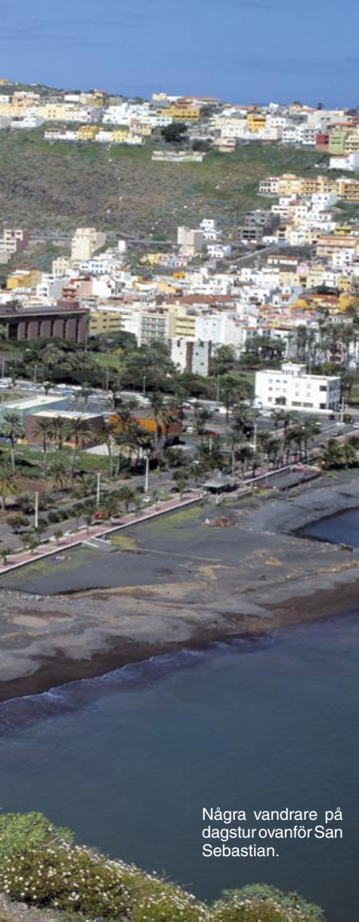
Några vandrare på dagstur ovanför San Sebastian.