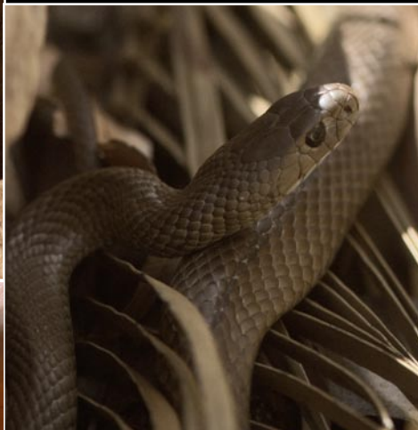
Den biologiska mångfalden i öknen är imponerande. Vi nästan trampar på en dödligt giftig "eastern brown" och kan röra vid en skinködla.

På begäran finns min packning hos Heavitree Hotell i Alice Springs. Efter en inspirerande middag bestående av smakligt kängurukött sorterar vi prylarna för fyra dagars vandring i the Outback.