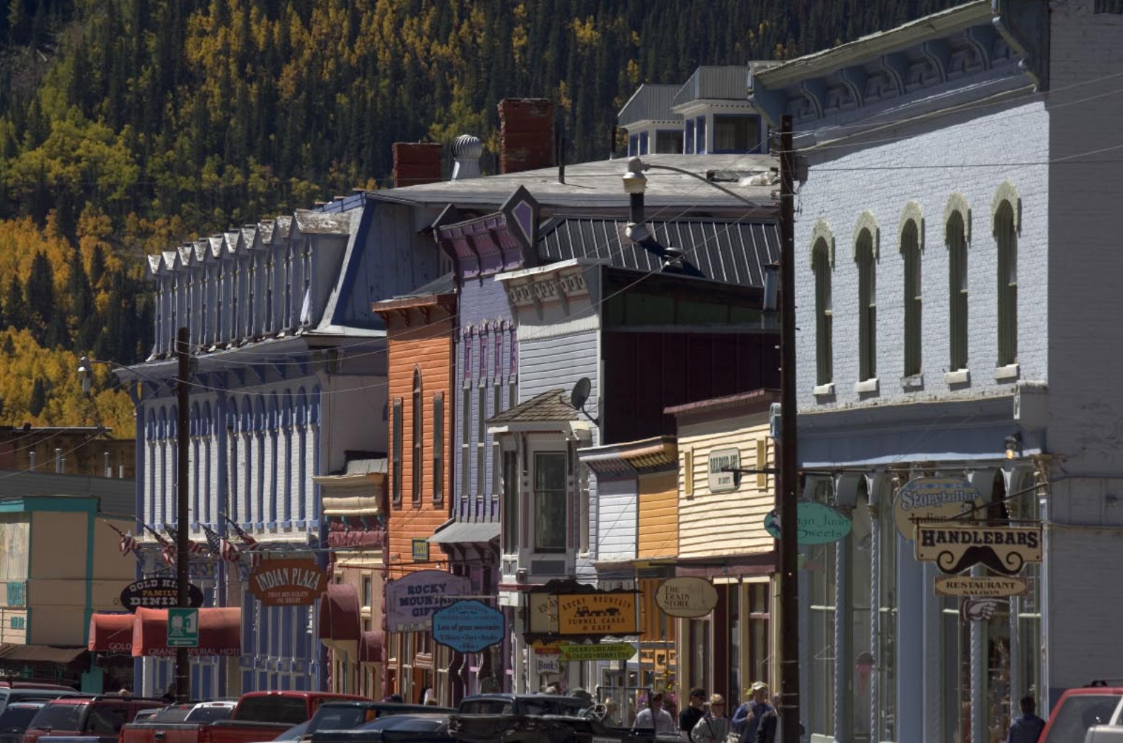
Greene Street i guld- och silverstaden Silverton. Järnvägens slut mitt i Silverton. Ute Mountain Casino är en viktig inkomst för indianerna. Downtown Durango med Diamond Belle Saloon i Strater Hotel. Ute Mountain Tribal Park är SV Colorados intressanta indianreservat söder om Mesa Verde, öppet för turister.