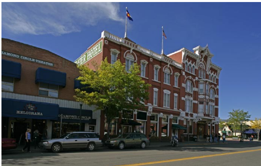
På Main Avenue står en av Durangos vackraste byggnader, Strater Hotel från 1887, byggd med 376 000 tegelstenar och handsnidade fönsterposter i sandsten.

Åter i Durango beger jag mig ned mot sydväst med min hyrbil. Hamnar i Four Corners, den enda punkten i USA där fyra delstater möts: Utah, Colorado, Arizona och New Mexico. Monumentet, en stor plattform märkt med ett kors, är ointressant i sig men det är en kul turistgrej att låta sig fotograferas medan man står i fyra stater samtidigt. Mer