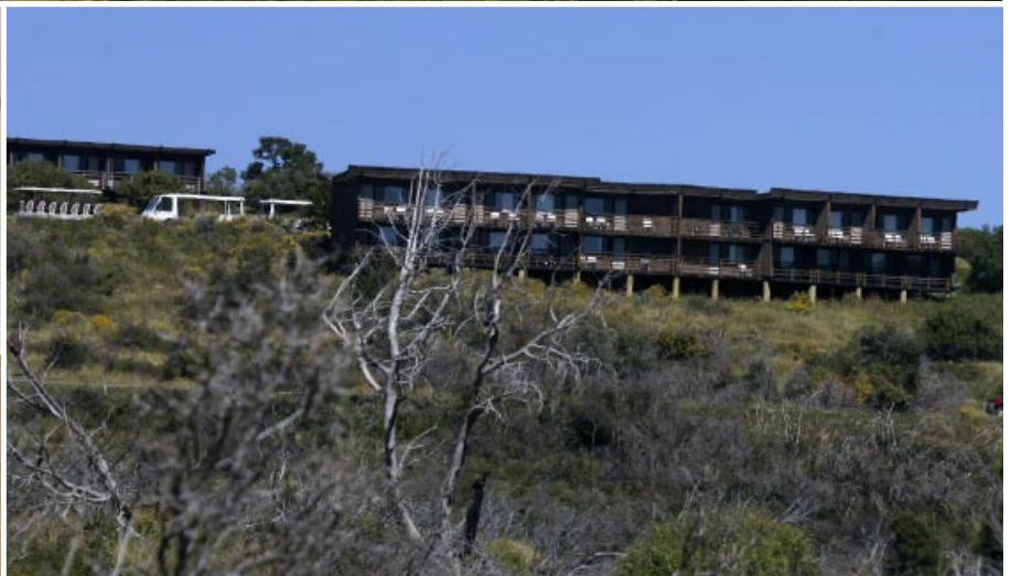
Far View Lodge är enda hotellet i Mesa Verde. Där serveras wapitihjort på tallrik med fornindianernas mönster, jämför det 700 år gamla kärlet.

▷ Colorado. Han blev kvar i fyra månader som den förste vetenskapsmannen uppe bland ruinerna, endast 22 år gammal. Om Cliff Palace skrev han: "Väl förtjänar denna ruin sitt namn, ty med sina runda torn och höga ljusa murar ... trotsande tidens förstörelse, liknar den på afstånd ett sagans trolslott."