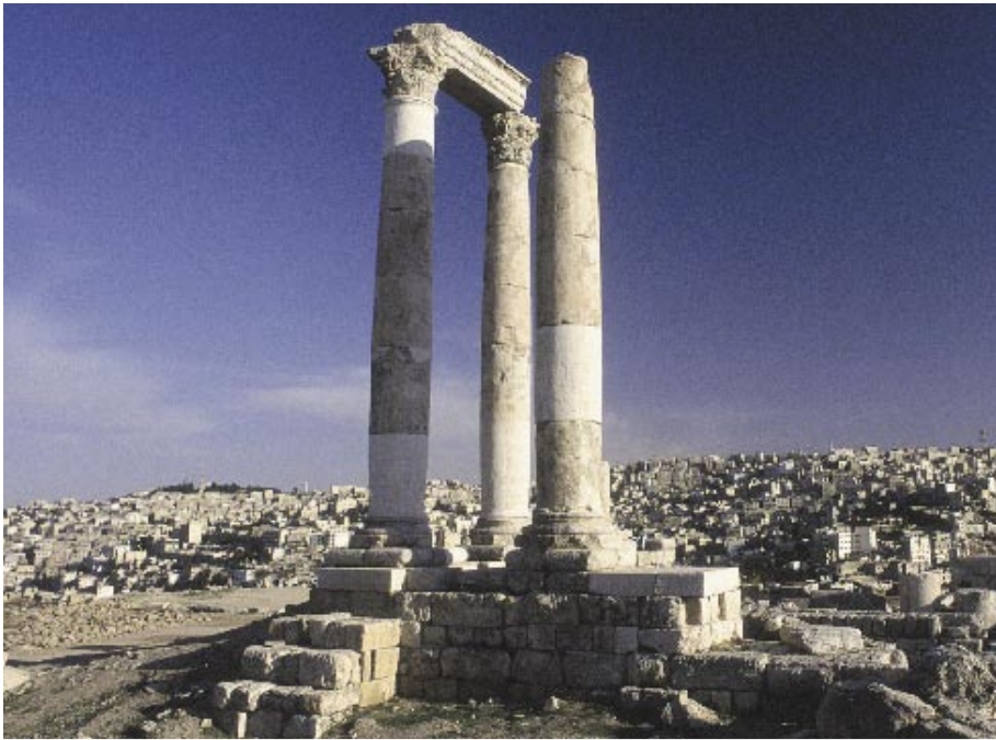
Citadellet med tempelruiner från romartiden ligger i östra Amman.

Vacker keramik och handvävda mattor visas på konsthantverkscentret i Madaba.