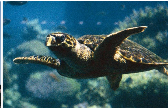
I Aqaba finns ett rikt undervattensliv.

Västra Amman är de rikas stadsdel med västerländsk prägel och modern arkitektur. Här ligger lyxhotellen på rad. På bilden Le Royal.