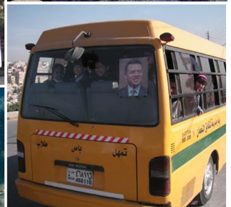
Alla skolbussar har sin egen idolbild av kung Abdullah.