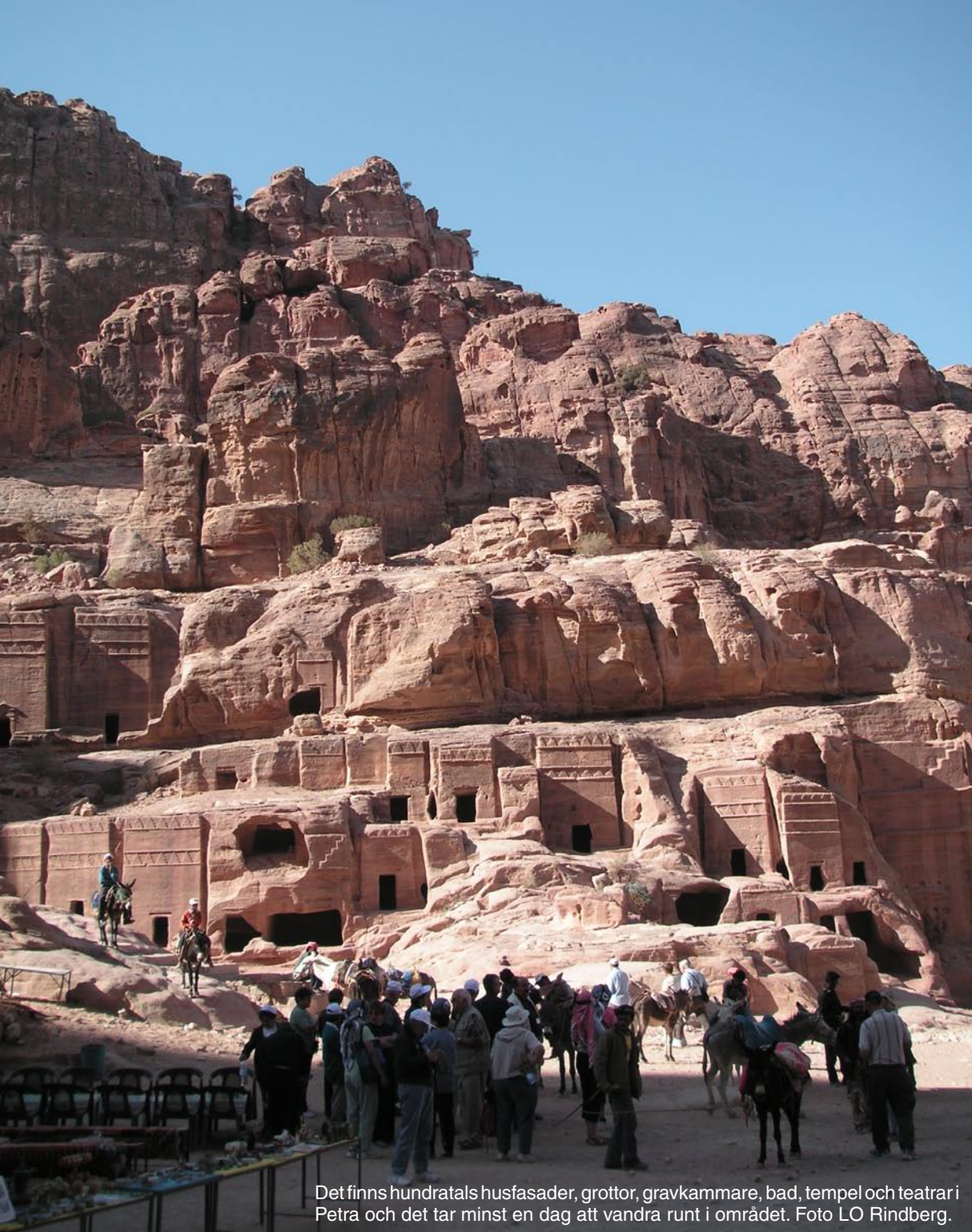
Det finns hundratals husfasader, grottor, gravkammare, bad, tempel och teatrar i Petra och det tar minst en dag att vandra runt i området.