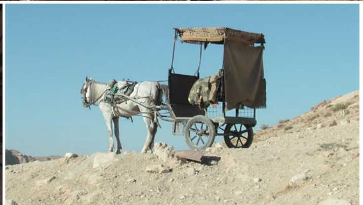
Med häst och vagn tar sig många besökare den knaggliga vägen fram till världskulturarvet Petra.