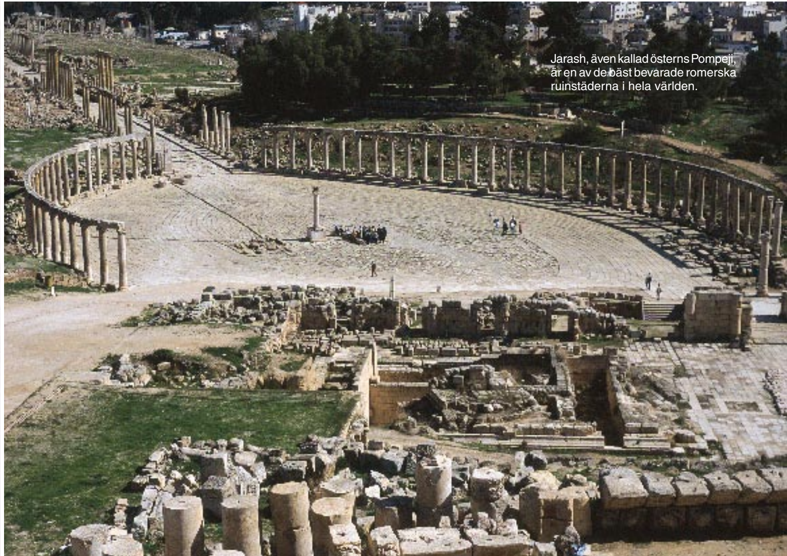
Jarash, även kallad österns Pompeji, är en av de bäst bevarade romerska ruinstäderna i hela världen.