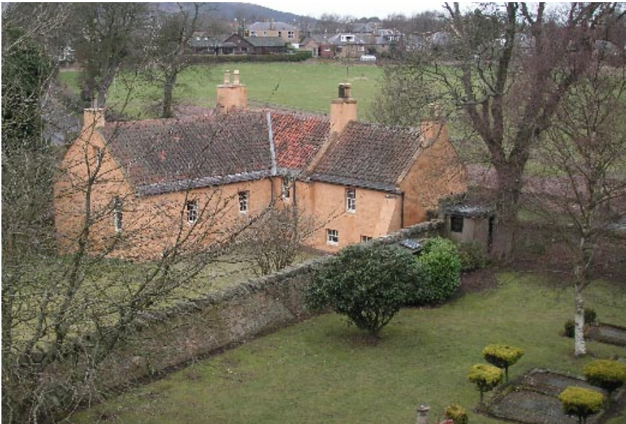
Den idylliska gården alldeles intill Rosslyn Chapel, där Sophie Neveu får veta sanningen om sin släkt.

► Abbey. Även i övrigt hittade filmteamet många perfekta miljöer i Lincolnshire och här var de vamt välkomna.