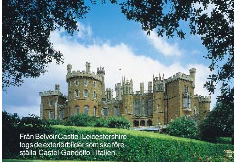
Från Belvoir Castle i Leicestershire togs de exteriörbilder som ska föreställa Castel Gandolfo i Italien.