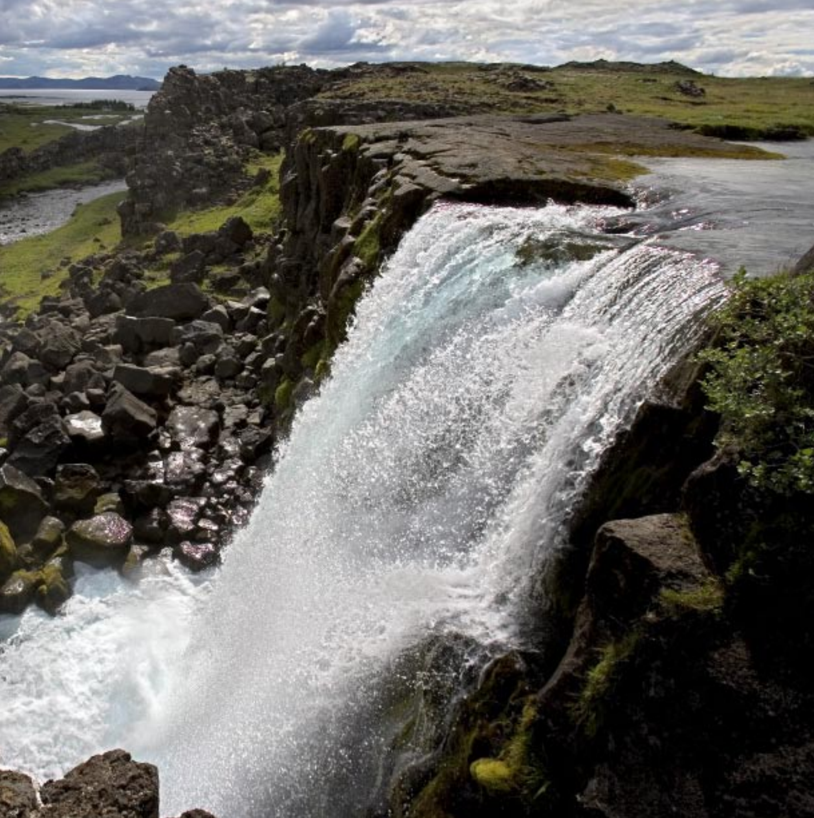
Öxará faller vilt brusande ned i gravsänkan vid Tingvalla och fortsätter sin färd mot sjön Tingvallavatn i fjärran.

ting. 930 sammanträdde det isländska Alltinget första gången. Företeelsen brukar kallas "världens första parlament". Det var en demokratisk mötesform som tillät och uppmuntrade alla närvarande folkrepresentanter att lägga fram sina bekymmer. Här skapades och verkställdes landets lagar. Vid Lögberg, Lagberget, träffades de 39 rådsmedlemmarna från hela Island varje år under två veckor efter midsommar. De bodde vid kullen i små stenhyddor vars överväxta grunder man fortfarande kan ana och de satt i en ring när de sammanträdde.