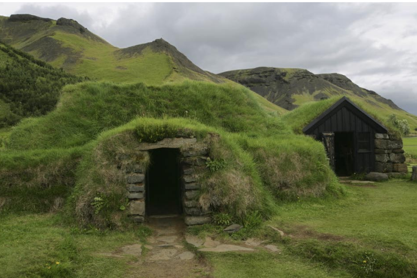
Förrådshus med tak av torv, mossa och gräs vid Skógar.

Öxará föds vid tusenetersfjället Botnssúlur i väster och dansar utför sluttningarna alltmedan den växer från en skvättande fjällbäck till en mindre älv. Där fjällen planat ut vandrar vi intill älven i dess strömriktning, på en stig som vindlar sig fram genom sparsam fjällvegetation. Bruset ökar kraftigt i styrka innan vattenmassan plötsligt försvinner över en tvärkant av svart lavasten och störtar några tiotal meter ned i Almannagjá, Allemansklyftan.