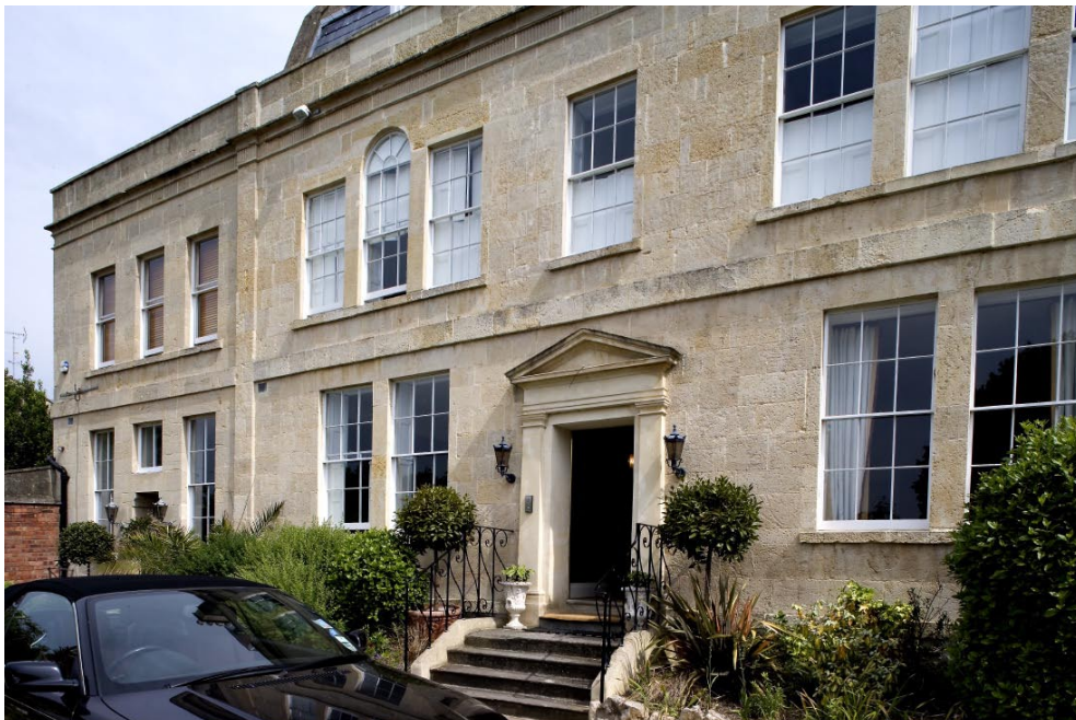
The Residence utstrålar renhet med sin fasad av Bath-sandsten (t v) och medan trädgården på baksidan är en lustgård med många vackra detaljer på liten yta. Nedan.