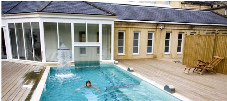
Bath Spa Hotel är ett trädgårdsinbäddat, f d privatpalats (ovan) med fräscha tillbyggnader för en mångsidig spa-anläggning. Vänster.

▷ pund nyrenoverade, grekisk-inspirerade spa-hotellet. Det ligger mitt i en lumrig engelsk trädgård med fontän, staty och litet tempel, och gränsar dessutom till Sydney Gardens. Ett jätteplus är att det ligger bara tio minuters promenad genom vackra parker in till centrum, och ändå upplevs ligga avsides i vacker natur. Utmärkelsen har regnat över detta etablissemang.