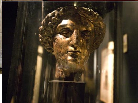
Från vänster prins Bladud som botades av Baths källvatten, Gorgons huvud som representerar guden Sulis Minerva, brons huvudet av Minerva, samt ett av fynden från den tidigaste kyrkan där Bath Abbey står idag.