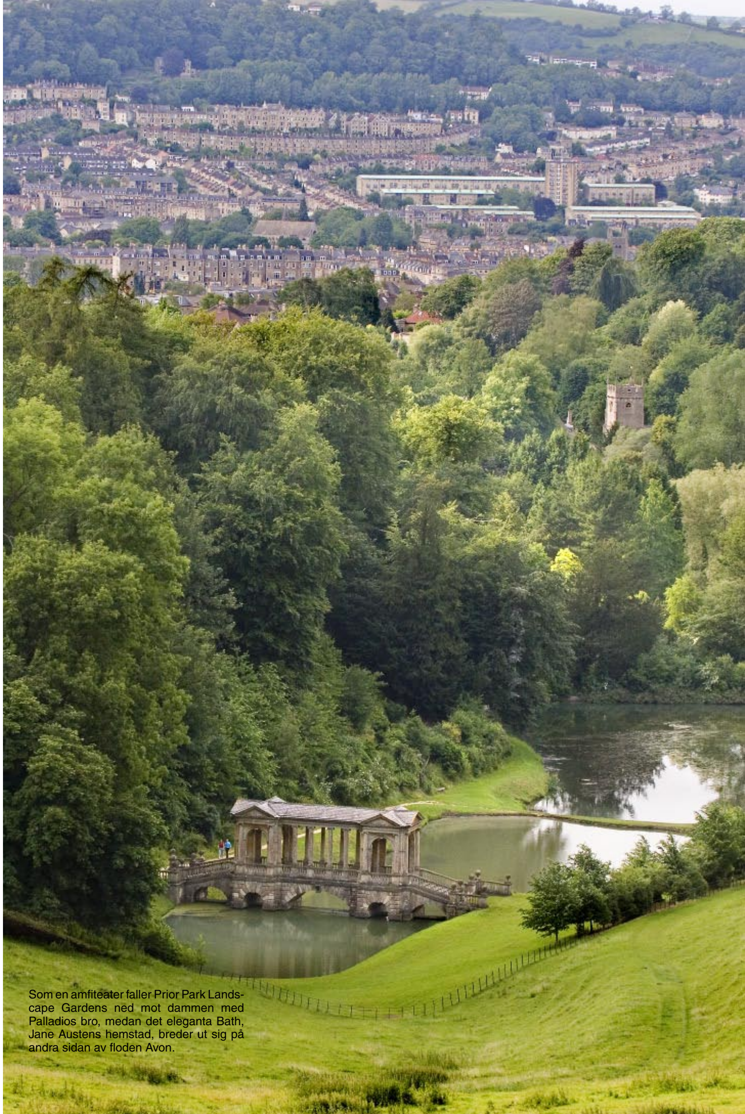
Som en amfiteater faller Prior Park Landscape Gardens ned mot dammen med Palladios bro, medan det eleganta Bath, Jane Austens hemstad, breder ut sig på andra sidan av floden Avon.