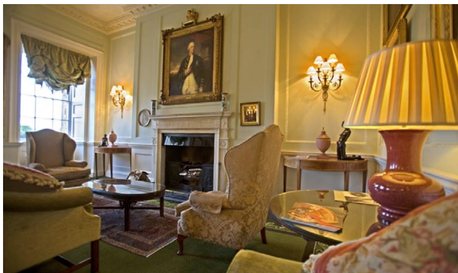
Kung Georg III hade en egen etagevåning i Royal Crescent för 200 år sedan. Än idag följer hans porträtt ovanför marmorspiskransen i hotellets sällskapssalong vad som sker.

Under 1700-talets första år besökte Queen Anne de omtalade källorna två gånger. Det kungliga intresset ledde till att en driftig, inflyttad man vid namn Beau Nash satte fart på både tankar och handlingskraft när det gällde att öka Baths elegans. Kvarter revs och nya växte upp under kungarna Georgs århundrade, ett nydanande som fortsatte in på 1800-talet. Ett av nytilskotten var The Circus, tre halvmånformade byggnader som bildar en cirkel exakt lika stor som det mytiska Stonehenge. Fasadernas tre våningar dekorerades med pelare som