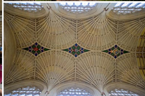
Folklivet på Abbey Church Yard (t v) är alltid livligt, i stark kontrast till Bath Abbeys inre, där sinnet söker frid under mittskeppets vackra solfjädersvalv. Ovan.

marmor. Spisarna har putsats upp liksom stuckaturerna, som i vissa rum är enastående. Samtliga drygt fyrtio rum är renoverade individuellt utifrån sina specifika karaktärer. Vår del har kvar mycket av sin gamla karaktär med bl a det ursprungliga parkettgolvet i trapphuset. Denna lägenhet tillhörde ingen mindre än "jordbrukskungen" Georg III, Englands regent i 60 år, 1760-1820. Vi bor i ett av dess rum, på bottenplanet.