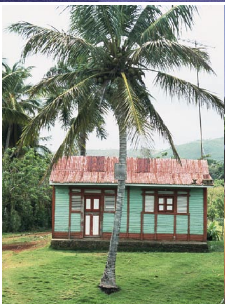
Pastellfärgade hus ser man överallt i landet.