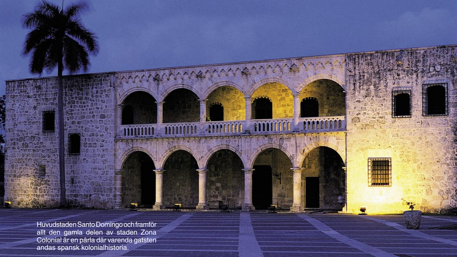
Huvudstaden Santo Domingo och framför allt den gamla delen av staden Zona Colonial är en pärla där varenda gatsten andas spansk kolonialhistoria.