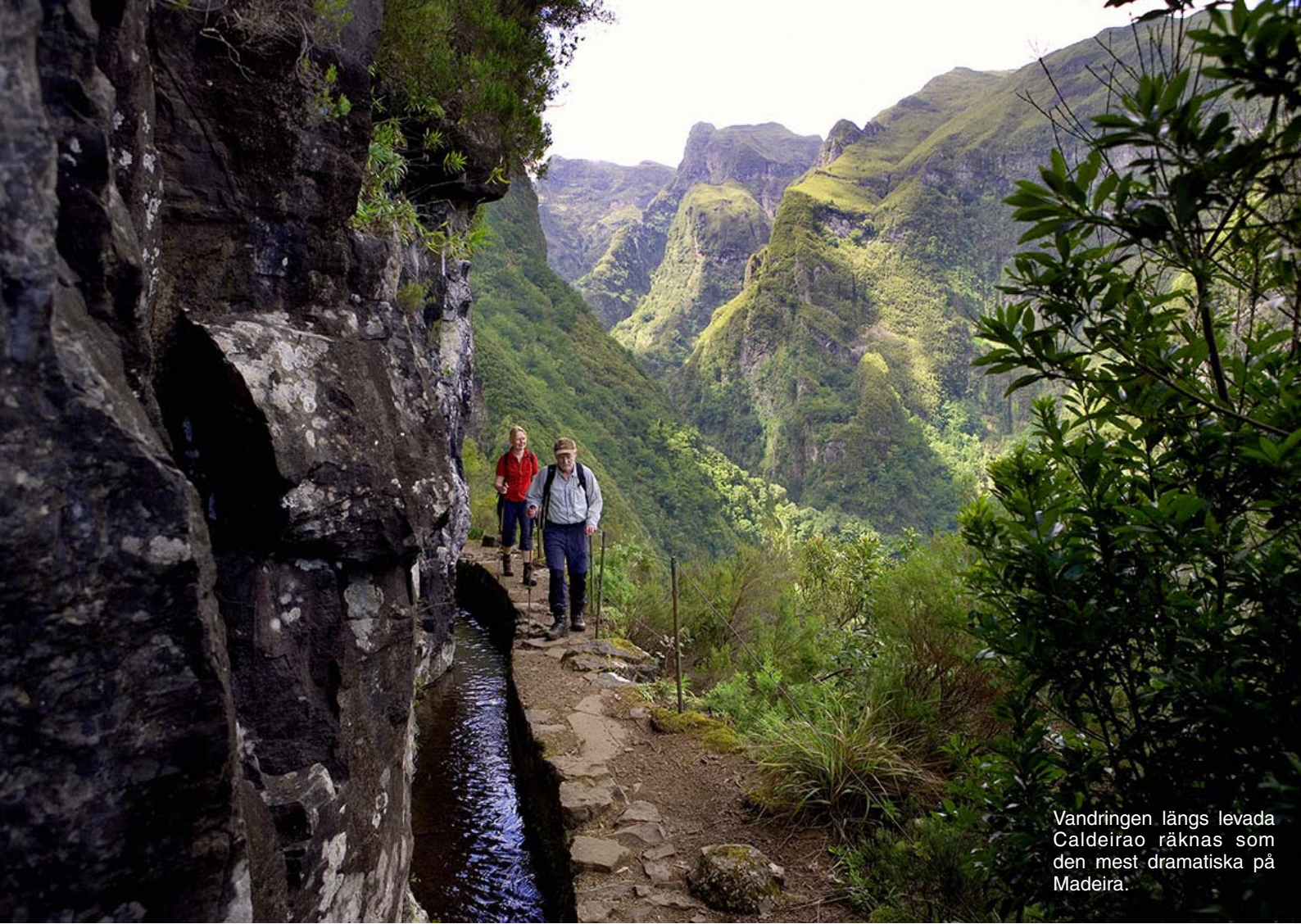
Vandringen längs levada Caldeirao räknas som den mest dramatiska på Madeira.