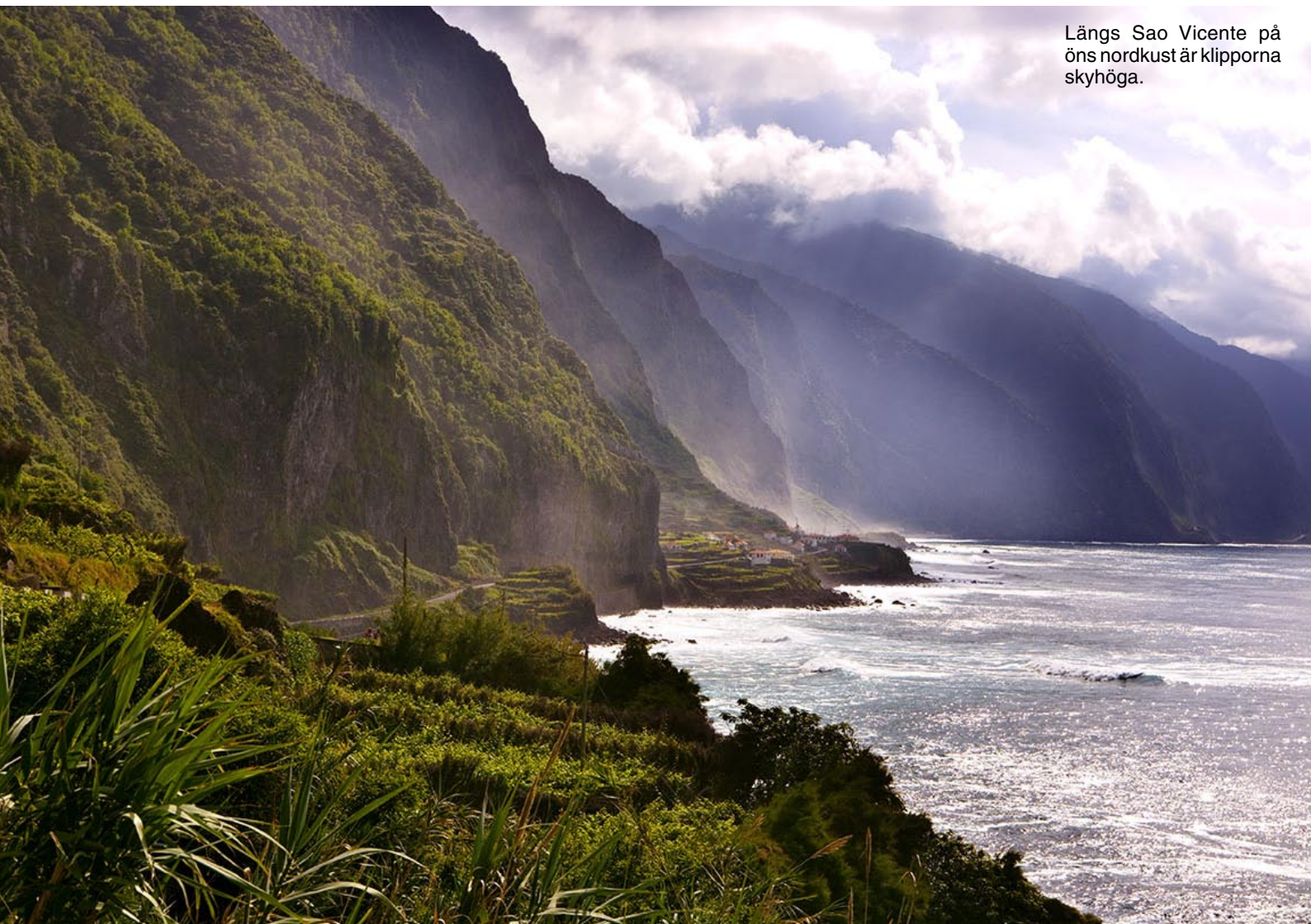
Längs Sao Vicente på öns nordkust är klipporna skyhöga.