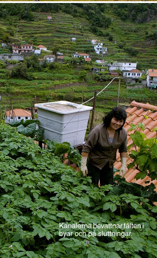
Kanalerna bevattnar fälten i byar och på sluttningar.

Från Atlanten i norr rör sig en bred molnmatta med tussar som krokar mot bergen långt under krönen. När solen börjar värma startar vi turen. Först ska man ta sig förbi Pico das Torres, öns tredje högsta och mest djärva berg, en svårbestigen historia som rundas. Från det välvda fjällkrönet där vi börjar går vi stigen rakt mot en lodrät bergssida där trappsteg som huggits ut, gör det lättframkomligt trots den svindlande exponeringen. Jo, man behöver vara en ganska van bergsvandrare för att känna sig trygg här, men riskfyllt, nej inte mer än vanligt. Hela denna sick-sackande kamvandring i allt starkare sollyster, upp och ned, hit och dit, genom klippvalv och utmed sugande stup, är en naturupplevelse av högsta rang. Och den utsökta regin som vi bevittnar, med molnmattan i norr och det blänkande ▶