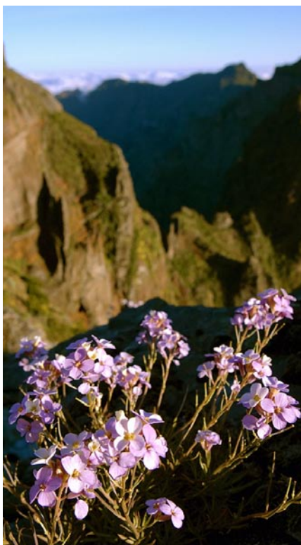
Uppifrån: Glada "levadeiros" rensar vattenkanalen i Caldeirao Verde. Madeira är känt för sina rika växtlighet, här en art av släktet cardamine.

Längre fram överger vi vattenkanalen och den bebyggda dalen för att gå till den vackra kuststigen från Machico till Ponta da Cruz. Nu får vi en uppförbacke. På andra sidan ett beskogat bergspass får vi se havet igen, och även halvön från igår dyker upp i öster. Här är kustbranten högre och mer utsatt än någonsin. Vi ser stigen slicka stupen i färdriktningen, flera hundra meter ovanför vattnet. Har man anlag för svindel kan fortsättningen kännas påfrestande. Men det är varken svårt eller osäkert att gå, snarare lustfyllt och inspirerande. Dagens mål är den gamla hamnstaden Porto da Cruz, som ligger intill ett undersåttigt berg som kallas Penha de Águia – örnsklippan. Till slut går vi på en väg genom bebyggelsen och vid stadens torg tar vi en taxi tillbaka till bilen vid Portela, och fortsätter sedan för egen maskin längs kustvägen på norra Madeira.