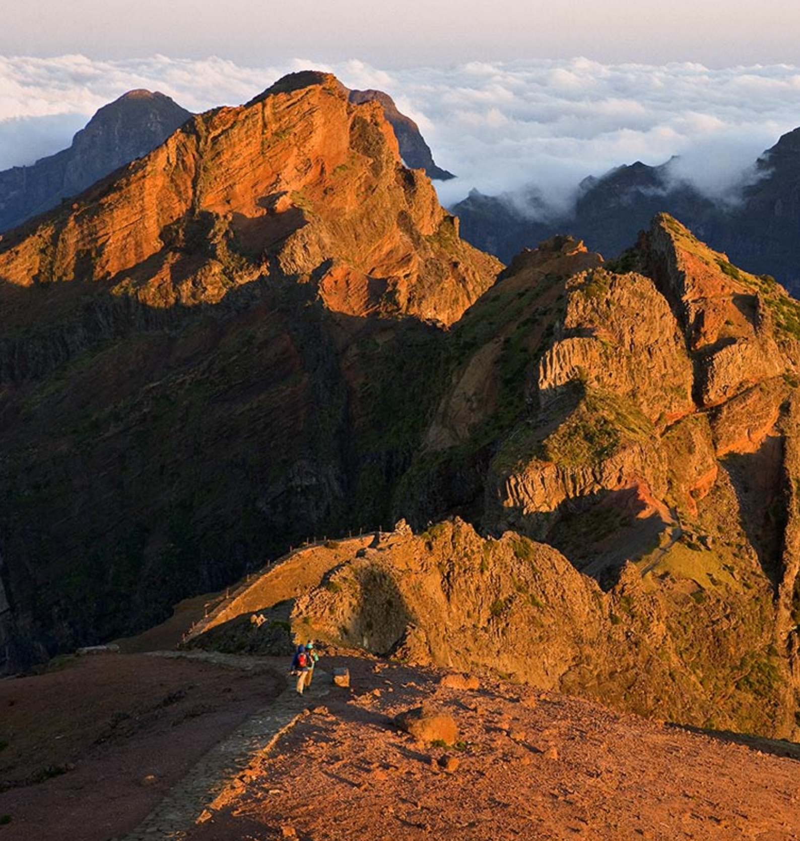
Några morgonpigga vandrare på väg mot Pico do Cidrao 1798 meter över havet i öns högsta massiv.

Med charterflyg kommer man lätt och billigt till populära semester mål. Det är ett bra sätt att uppleva nya miljöer för vandrare. På Madeira lockar de berömda vattenkanalerna, levadorna. Vi prövar dessa udda vandringsleder i maj månad och blir starkt tagna av öns storslagna bergsnatur.