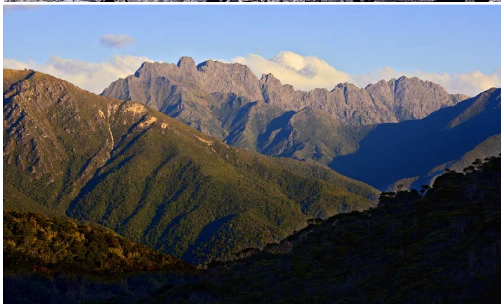
Uppifrån: En luftig hängbro förenklar passagen över Heaphy River. Från Mt Perry 1 238 möh blickar vi ut över de skogskädda bergen i nationalparken Kahurangi som genomkorsas av Heaphy Track. Mt Inaccessible står i solnedgången. Dessa orörda bergstrakter i Kahurangi har föreslagits bli ett världsarv framöver.