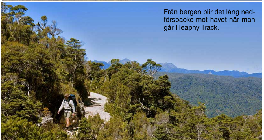
Från bergen blir det lång nedförsbacke mot havet när man går Heaphy Track.