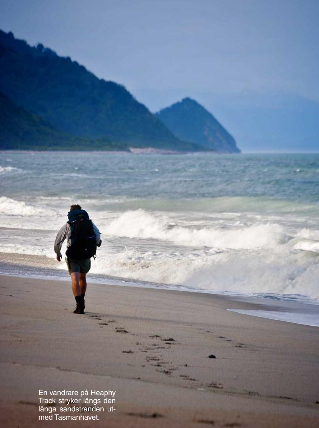
En vandrare på Heaphy Track stryker längs den långa sandstranden utmed Tasmanhavet.