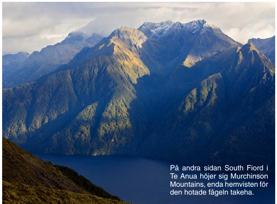
På andra sidan South Fjord i Te Anua höjer sig Murchinson Mountains, enda hemvisten för den hotade fågeln takeha.