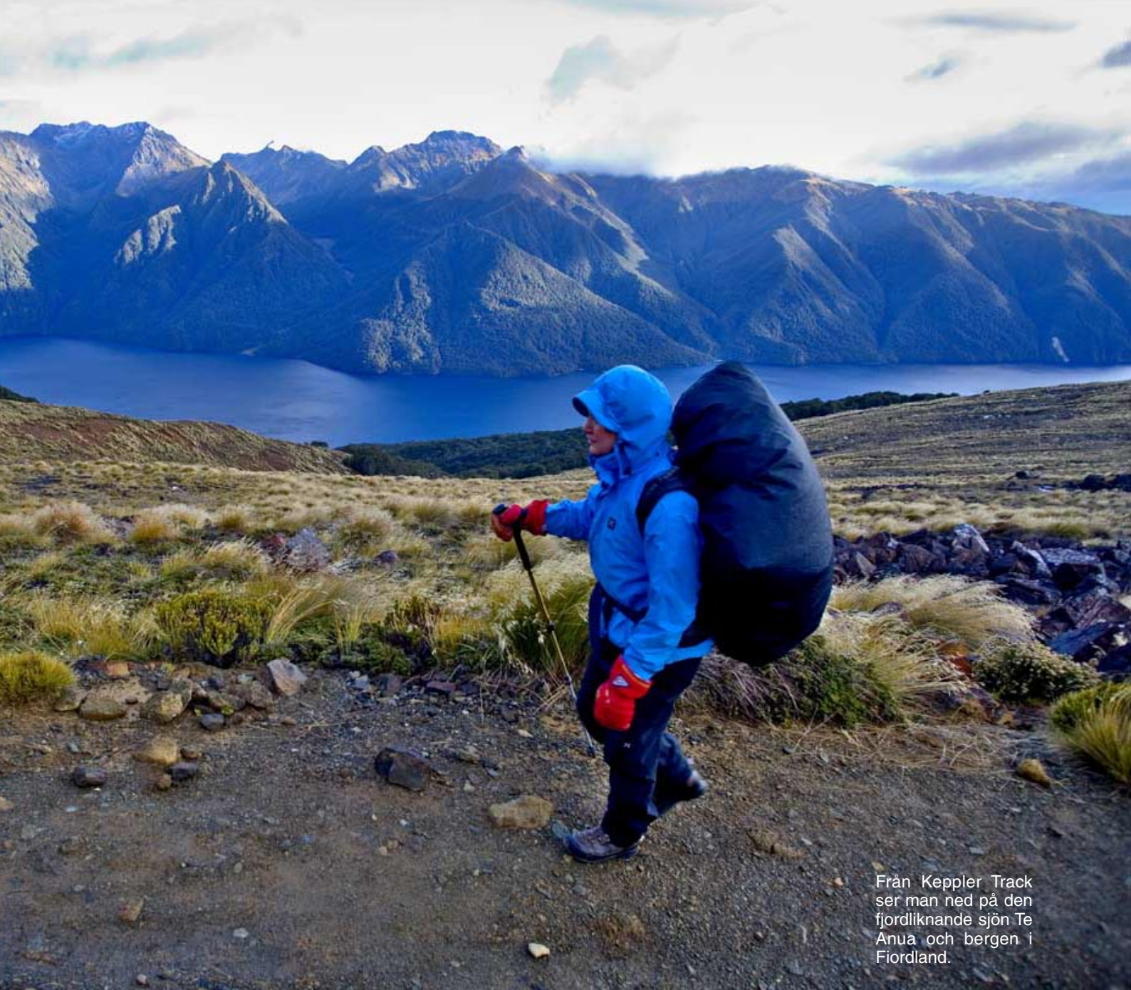
Från Kepler Track ser man ned på den fjordliknande sjön Te Anua och bergen i Fiordland.