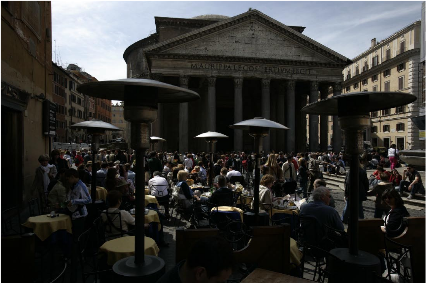
Ovan: Piazza della Rotonda drar mycket folk tack vare det antika templet Pantheon, det äldsta i Rom. Nedan: Forum Romanum med Septimius Severus triumfbåge och Antoninus Pius och Faustinas tempel. 500 meter bakom Forum reser sig det överdrivna Victor Emanuele-monumentet.