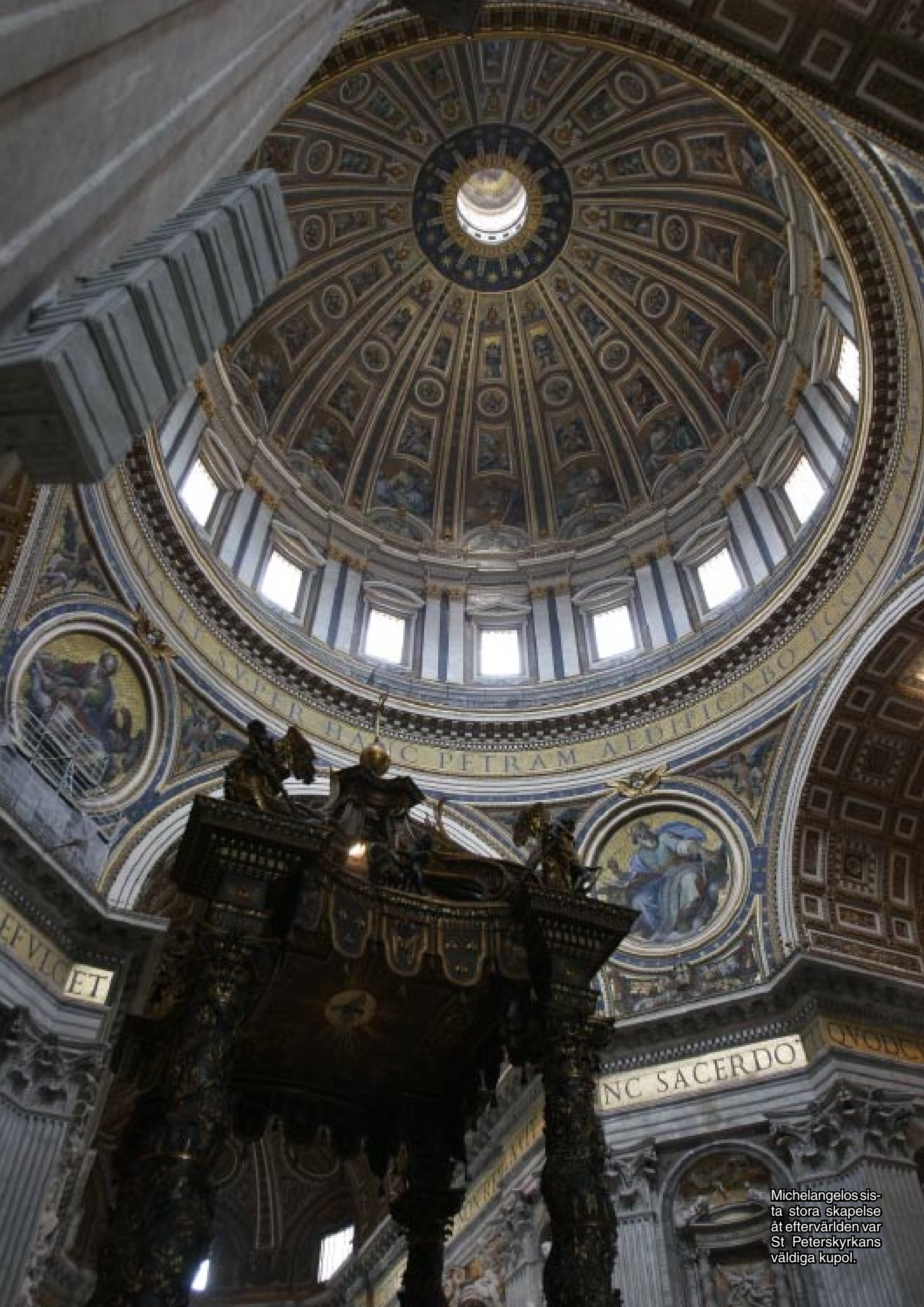
Michelangelosista stora skapelse åt eftervärlden var St. Peterskyrkans väldiga kupol.