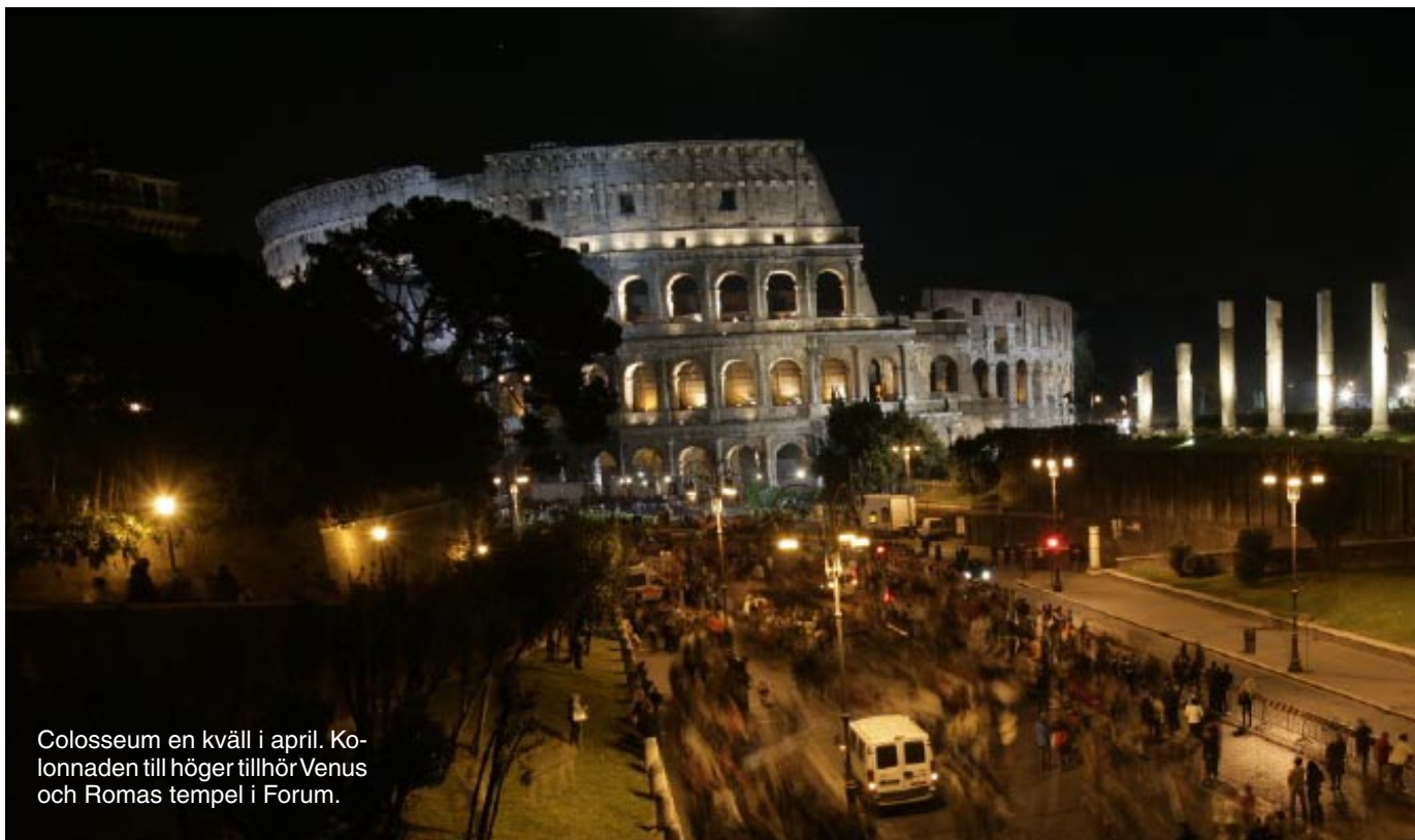
Colosseum en kväll i april. Kolonnaden till höger tillhör Venus och Romas tempel i Forum.

▷ seum som utgångspunkt. Utanför Rom mosades femton kyrkor under liknande vägprojekt. Tack och lov hann han aldrig påbörja sitt planerade jättepallats intill Forum, man darrar vid blotta tanken.