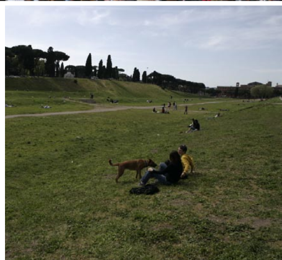
Uppifrån: Romersk soldat. Katolsk påskprocession på St Petersplatsen. Romarnas kapplöpningsarena Circus Maximus.