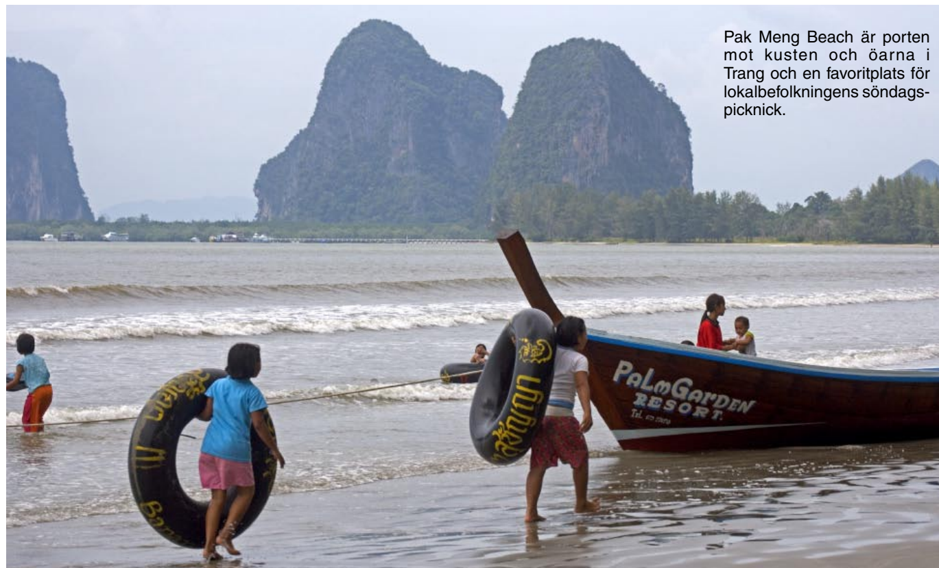
Pak Meng Beach är porten mot kusten och öarna i Trang och en favoritplats för lokalbefolkningens söndagspicknick.