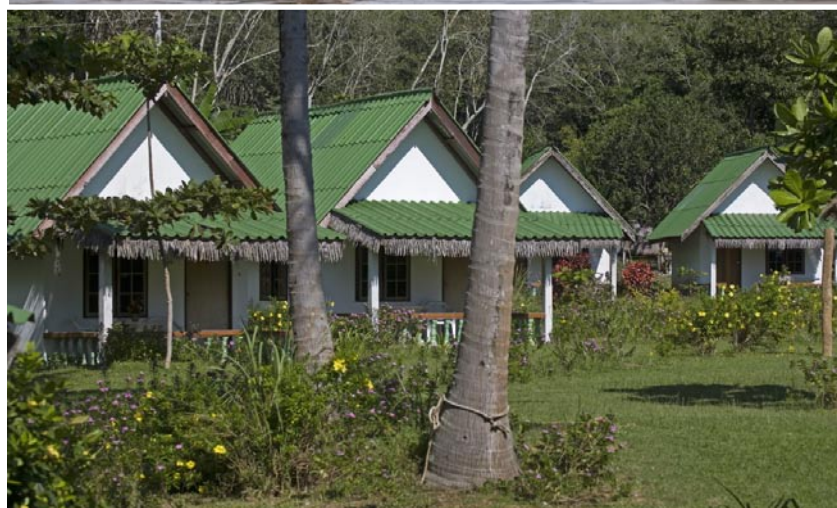
Libong Nature Beach Resorts bungalower är rustika och vänliga mot miljön.