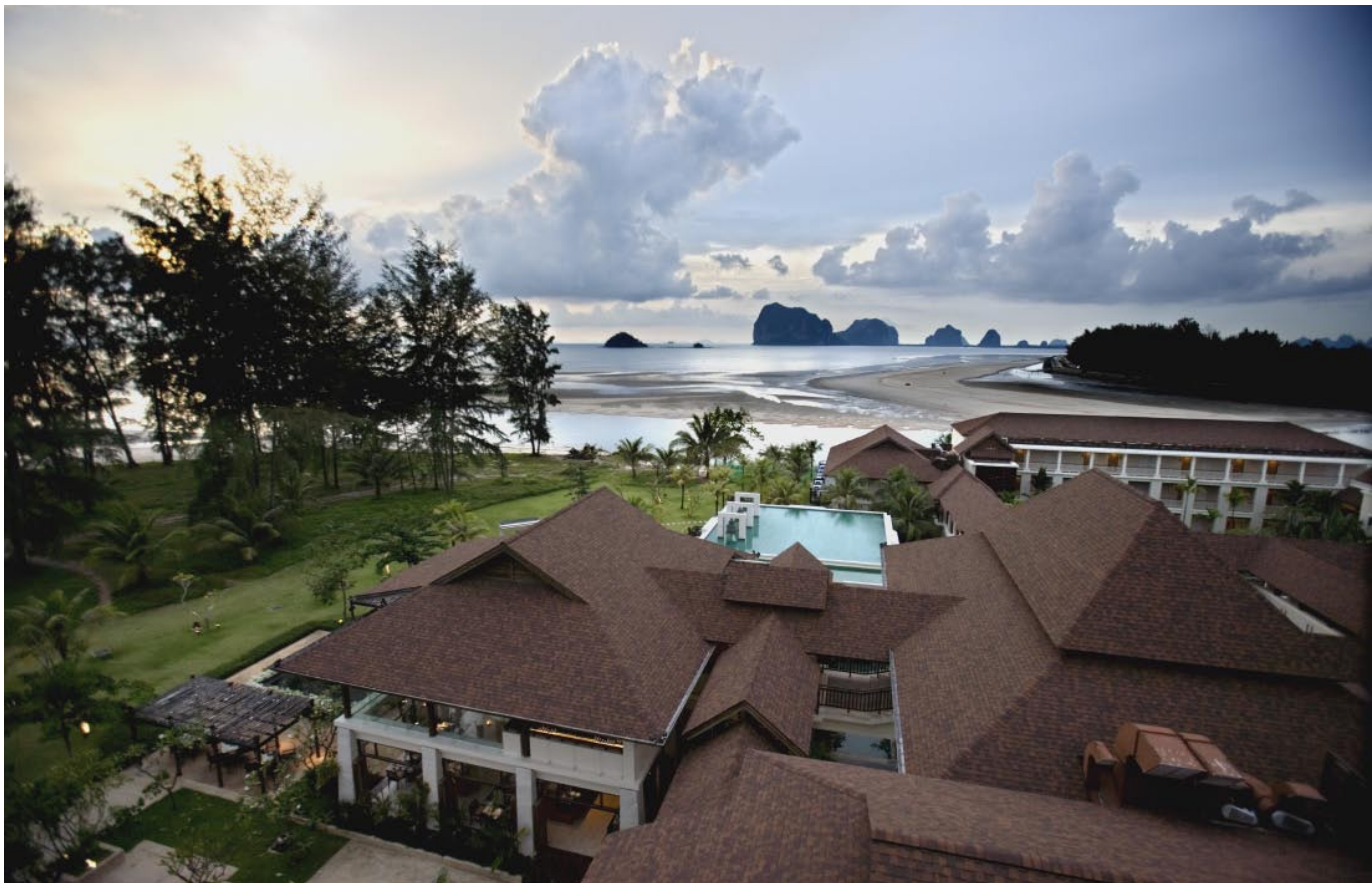
Amari Trang Beach Resort har inte bara drömläge, utan också gott rykte för sin miljö-satsning (ovan) och för exotiska Sivara Spa (höger).

► en gammal handvevad mangel som fortfarande används för att pressa det stelnade rågummit till hanterliga latexmattor, som sedan torkas på klädstreck innan de säljs till uppköparna.