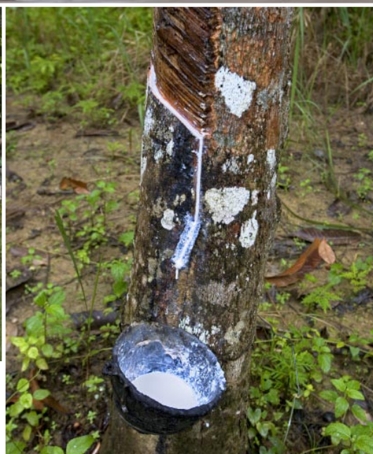
Saven från gummiträdet samlas upp i skålar tillverkade av kokosnötter.

► koppla av med en spa-behandling har Amari öppnat Sivara Spa med en mycket vacker, rogivande design. På Amari finns också fem ställen man kan äta på, trots att hotellet inte är särskilt stort. Allt från gourmetrestaurangen Aqua Italia till den mysiga Beach House.