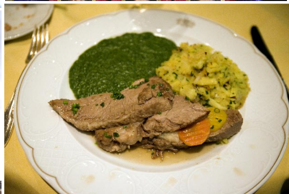
Frans Josefs påstådda favoriträtt tafelspitz, här serverad på Grand Hôtel Wiens restaurang Grand Café.