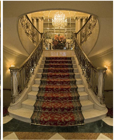
Grand Hôtel Wien ligger vid Ringstrasse nära Operan. Det blev klart 1870 och har en intressant historia att berätta. Ovan lobbyns "galatrappa".