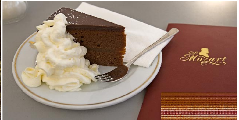
Wiens mest kända bakverk, Sacher-tårten.