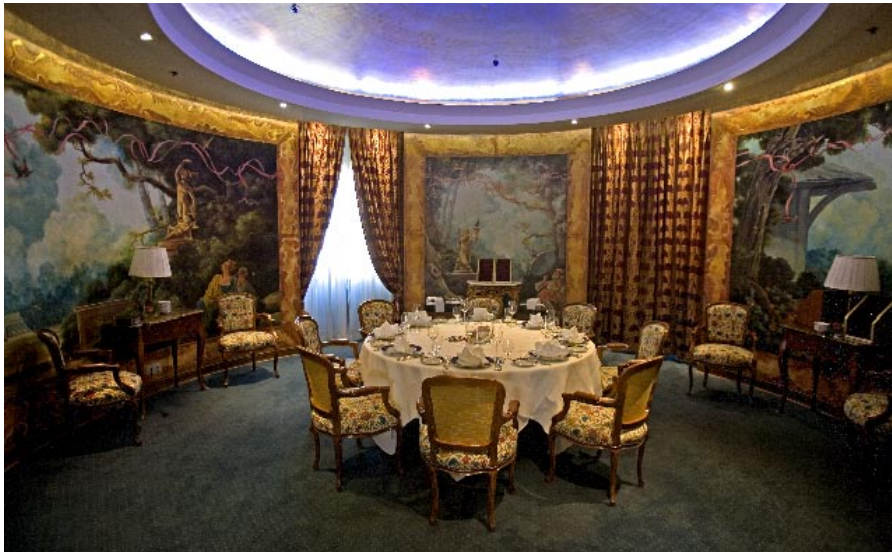
La Ciel är en av de välkända bra restaurangerna i Wien. Den ligger högst upp i Grand Hôtel Wien med utsikt över Ringstrasse.

▷ Rummen är rymliga, bekväma och skönt inredda. Vårt tillhör de minsta men är ändå på 45 kvadratmeter. Grands gourmetrestaurang är La Ciel högst upp i huset med utsikt över ringboulevarderna och stadskärnan. En diger vinlista och matkompositioner i en omtalat smaklig blandning av franskt och wienskt gör inte utsikten sämre, särskilt inte under sommaren då man kan inta dem ute på takterrassen.