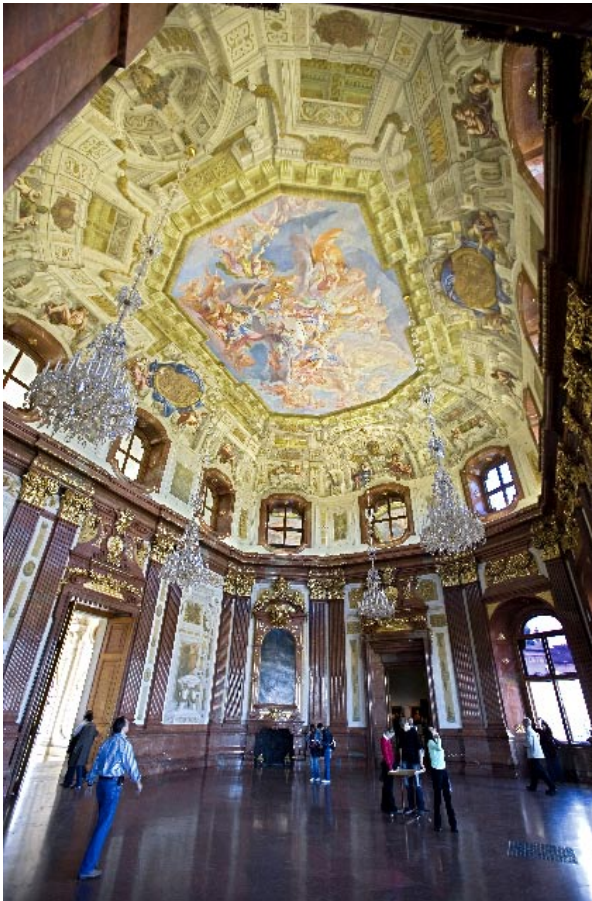
En av Belvederepalatsets imponerande salar med målat kupoltak.