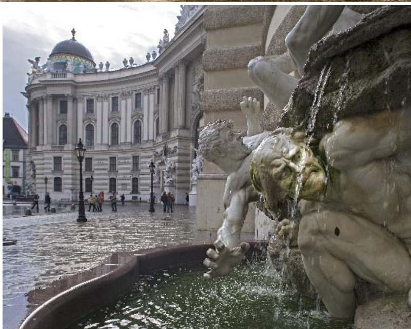
En av de vackra spiegelsalarna i palatset Albertina (vänster) och Nationalbiblioteket med dess dramatiska fontänen (ovan). Bägge utgör olika delar av kejsarnas palatskomplex Hofburg.

▷ följande kvartsseklet en extraordinär barockkyrka. Den väldiga kupolen med sin inre pelargång har prägel av antiken och sidoportalerna av Kina. Frontkolonnerna är en märklig blandning av den muslimska Orientens minareter och Trajanus och Markus Aurelius kolonner i Rom. Men Karlskirche är inte döpt efter kungen som lät uppföra den, utan efter pestskyddshelgonet Karl Borromeo. Schönbrunn och Karlskirche ritades bägge av den store von Erlach, som också var mannen bakom wienerpalatsen Schwarzenberg och Brenner.