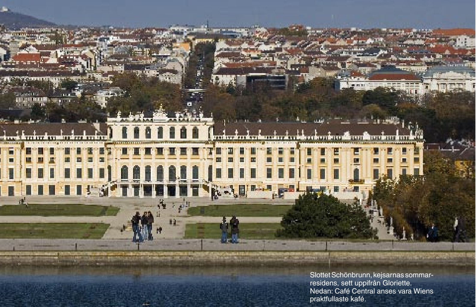
Slottet Schönbrunn, kejsarnas sommarresidens, sett uppifrån Gloriette. Nedan: Café Central anses vara Wiens praktfullaste kafé.