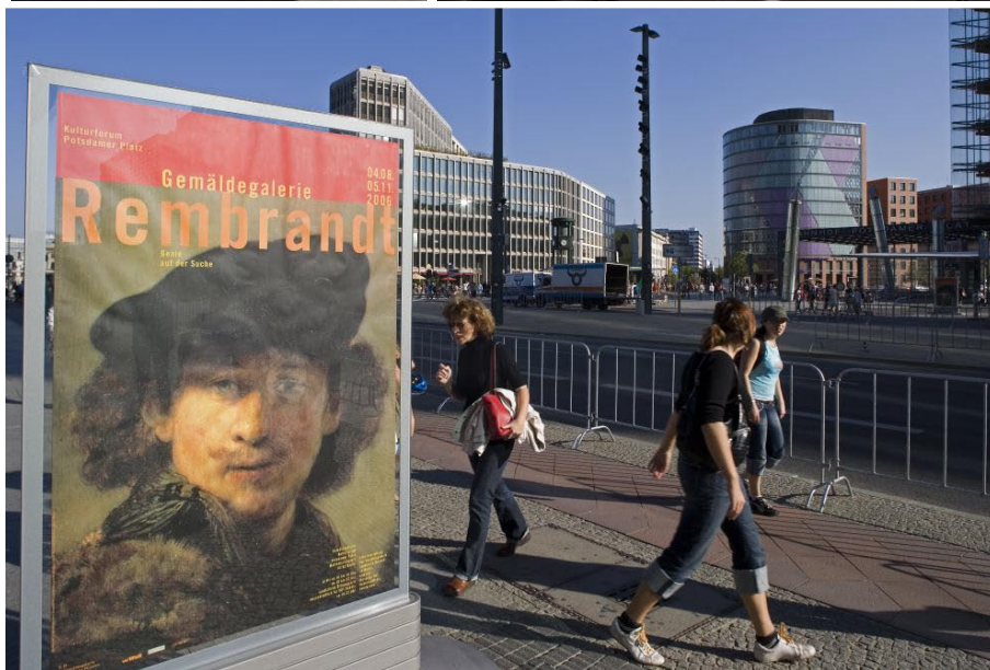
I Berlin pågår ständigt spännande konstutställningar. Ovan reklam vid Potsdamer Platz för en Rembrandtutställning.

► ottomanska riket av tysken Carl Humann och rekonstruerades 1910 inne i Pergamonmuseet. Ett imponerande projekt med tanke på storleken. Den manshöga frisen med skulpterade gudar och jättar i kamp är 113 meter lång.