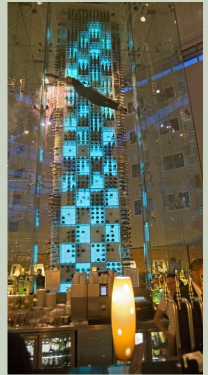
En akrobat svävar uppe i Radisson SAS säregna Wine Tower, granne med Stanstead.

Det passar på något sätt väldigt bra att ett etablissemang med Summer Lodges känsla för kvalitet och finess ligger inbäddat i ett så vackert landskap som Dorset County. □