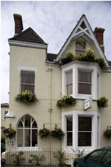
Chandler's Hotel tros ha ritats av den lokala legenden Thomas Hardy. I mitten vardagsrummet i den fordom privata villan från 1870-talet.