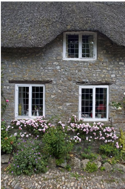
Typisk åldrig stenfasad, vasstak och spröjsade fönster på Tess Cottage i Evershot.