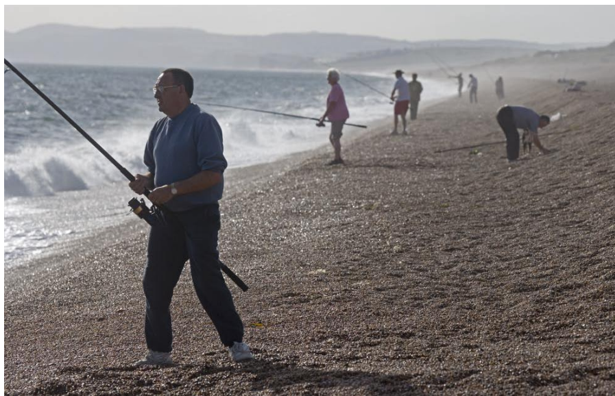
Sportfiskare med långa spön radar upp sig längs den märkvärdiga Chesil Beach.

och åter miljarder små jämnlipade klapperstenar. Stenröset når femton meters höjd och sträcker sig en och en halv mil längs kusten, från den medeltida byn Abbotsbury i väst till Weymouth i öst.