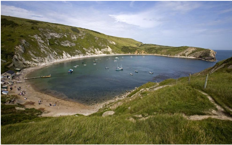
Två poolare i Dorset. Lulworth Cove på Jurassickusten och den nya spa-anläggningen i Summer Lodge i inlandet.