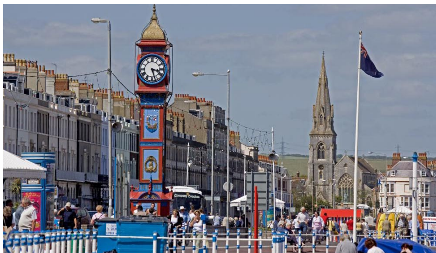
Weymouths pampiga strandaveny med drottning Victorias klocktorn.

Ett annat spektakulärt naturfenomen är Chesil Beach. En strand som är som en saga, förvånande med sin längd och osannolik i sin konstellation av miljarder