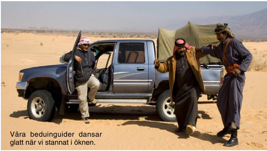
Våra beduinguider dansar glatt när vi stannat i öknen.