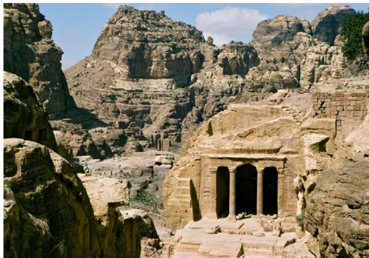
Nabatéerna byggde mängder av gravar med ståtliga stenfasad i Petra, denna kallas "trädgårdsgrav".

rad folkgrupper. I flera århundraden före modern tid ingick landet i det Osmanska riket, men under första världskriget delade Storbritannien och Frankrike upp området sinsemellan, och 1922 blev landet öster om Jordanfloden, huvudsakligen bestående av öken, ett emirat under prins Abdullah. Detta fick namnet Transjordanien och britternas överhöghet upphörde 1946 då området blev den självständiga staten Jordanien, som två årtionden senare förlorade Västbanken till Israel efter sexdagarskriget.