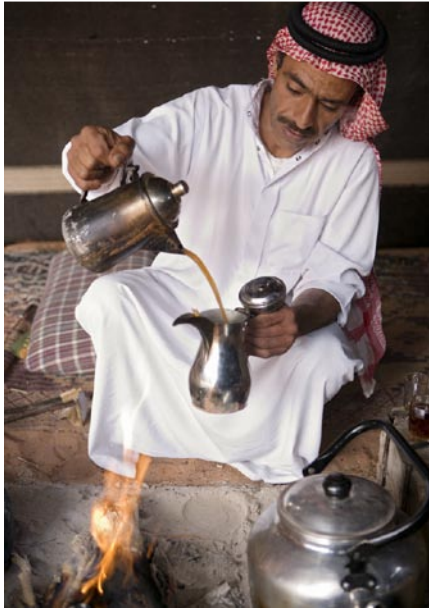
Kaffe är standarddrycken för beduiner, dricks i små glas utan öron.