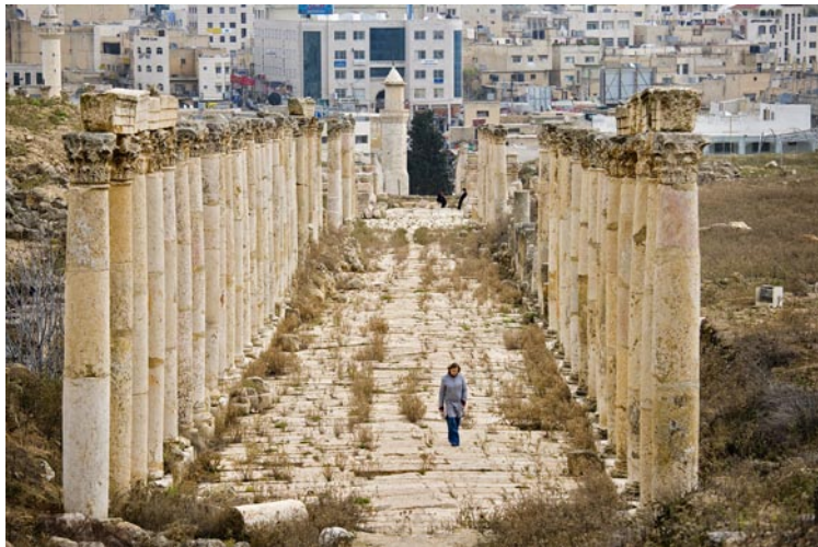
I Jerash norr om Amman står de romerska kolonnerna på rad.