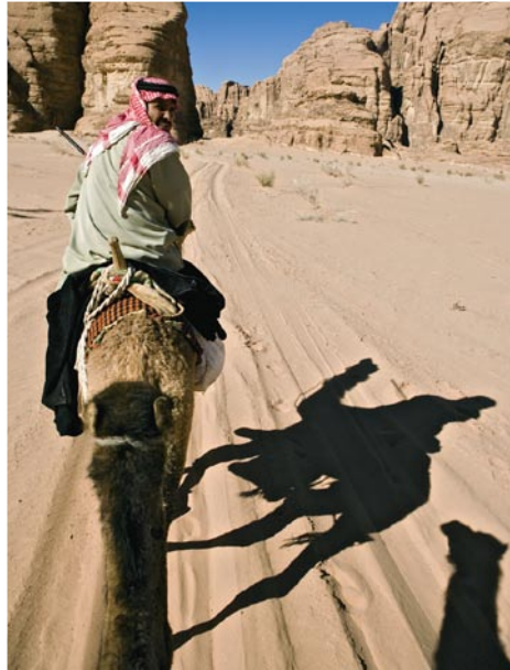
Från kamelens rygg får vi beduinernas perspektiv på landskapet.