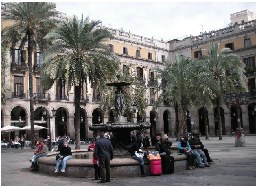
Plaça Reial är en av de populära mötesplatserna i Barcelona.

Under de senaste två decennierna har 540 offentliga skulpturer placerats ut i kulturstaden Barcelona.