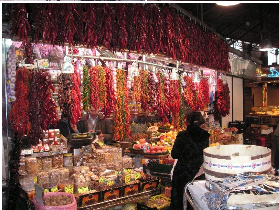
La Bouqueria är Barcelonas färgstarka, traditionsrika matmarknad med traditioner från början av 1840-talet.

En bit härifrån ligger en annan av Gaudis mycket berömda byggnader i Barcelona, numera ett världskulturarv,