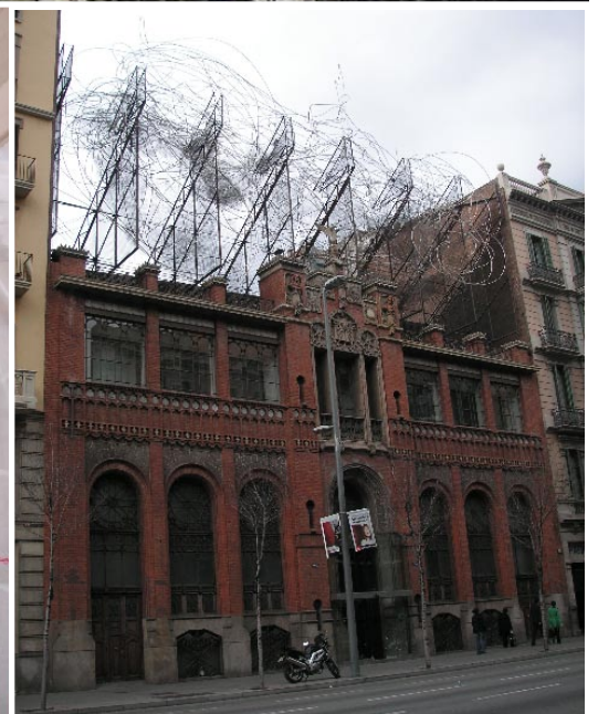
Antoni Tàpies museum med ett trassel av kromade stålrör på taket – ja, det är en skulptur.

kulturhus för samtidskultur inrymt i ett före detta klosterhärbärge. Tala om arkitekturkontraster!