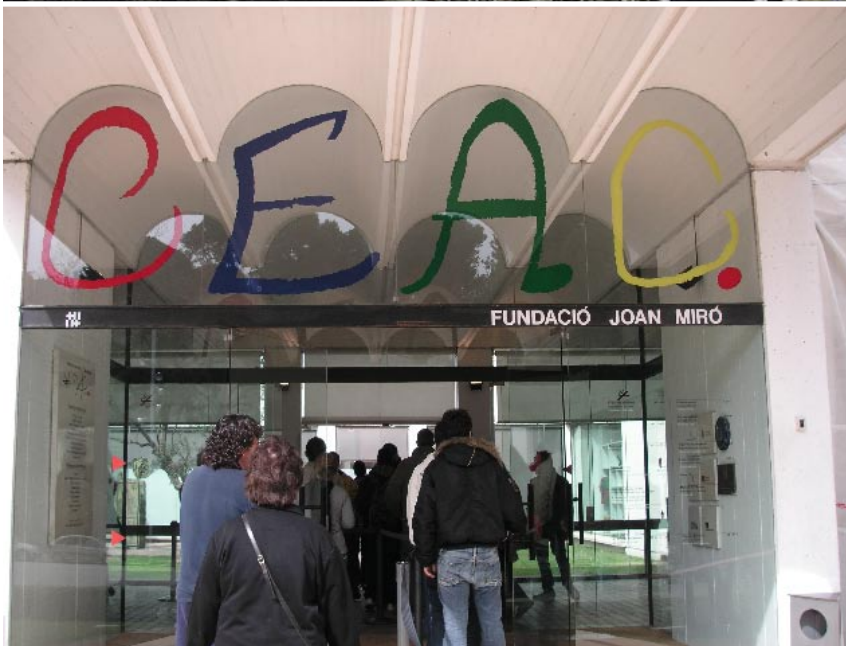
Till det populära Mirómuseet ringlar en ständig kö av besökare.