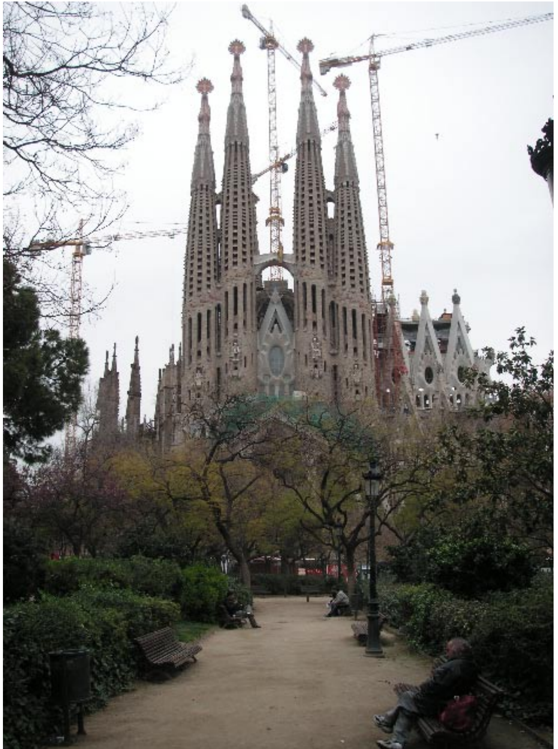
La Sagrada Família, Antoni Gaudis världsberömda katedral med sina stjärnprydda torn, spetsbågar och rika skulpturala utsmyckning, har blivit en symbol för hela Barcelona.

► som en gång ritades av en ung Antoni Gaudi – han skulle senare bli mer känd för sin katedral Sagrada Família.