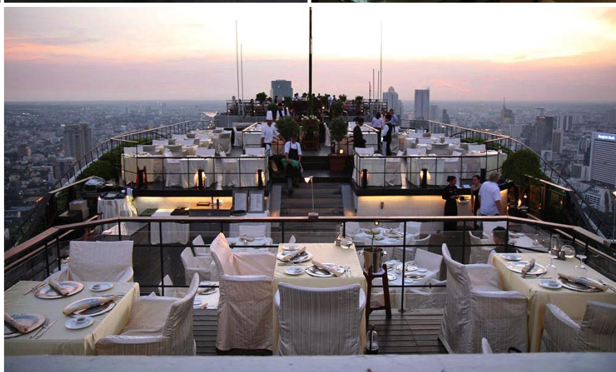
Vertigo och Moon Bar på taket av Banyan Tree.

finns inget som straffar Thiptara , inrymd i traditionella, öppna paviljonger vid flodkanten. "Botgör" sedan med ett pass i Peninsulas sybaritiska Spa by ESPA , plus några längder i dess unikt avlånga "klong"-pooler, och du är snart redo för nya goda livet -krafttag!