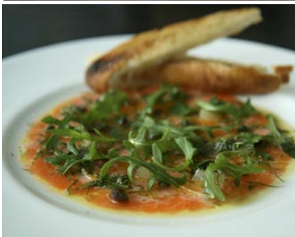
Uppifrån: Sparsmakad design på Cy'an, The Metropolitan; Martins signerade Met Bar på samma hotell; Carpaccio på svärdfisk à la Cy'an.

två bröder från Oz; den ene chefskock, den andre konditor. Svärdfiskcarpaccio, kryddig fläskkorv (wow, faktiskt! ), samt wagyu (typ "Kobe"-biff), är kanske de tre rätter vi helst skulle vilja upprepa under en eventuell framtida Bangkok-sejour. Met Bar är en het medlemsklubb och