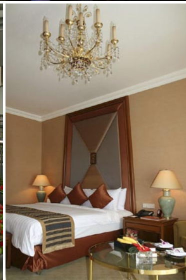
Medurs: Makalösa vyer "by night" från Sirocco och dess Sky Bar uppe på The Dome at State Tower; Stilfullt gästrum i Shangri-Las exklusiva Krungthep Wing; Flodutsikt från samma rum.

▷ jobbat dig upp hit (till 61:a våningen) må du vara ursäktad om du frågar: "Vad ska man på marknivå och göra?" Flera av Bangkoks läckraste barer och krogar uti det fria hittar du faktiskt bland molnen, långt ovanför gatans kaos och avgaser. Bai Yun förespråkar la nouvelle cuisine chinoise , vilken vi fann mindre nydanande än inspirerad. Och läcker! Höjdpunkten med Banyan Tree, bokstavligen, är Vertigo/Moon Bar . Här snackar vi inte några av Bangkoks utan världens högsta drinkvyer!. Synd bara att också skumpapriserna, liksom överallt i stan, tillhör världens stiffaste. Aspara , hotellets stolta flodkryssare, gör dagliga skymningsseglatser med drinkar och snacks för en spottstyver.