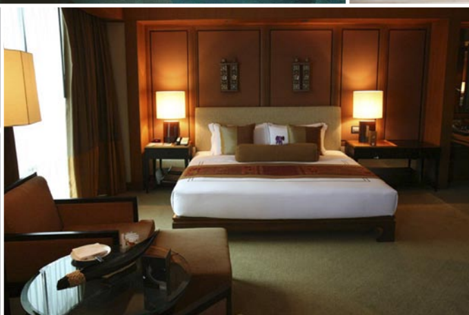
Vänster: "Nya kantonesiska köket" på Bai Yun, Banyan Tree; Generöst Executive Room på Conrad.