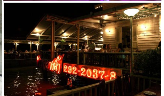
Medurs: Glada miner på Jim Thompson's; Flummiga färger på Bed Supperclub; Romantisk aftonmiljö på Baan Klang Nam; Gammeldags charm och dekor på Eugenia.