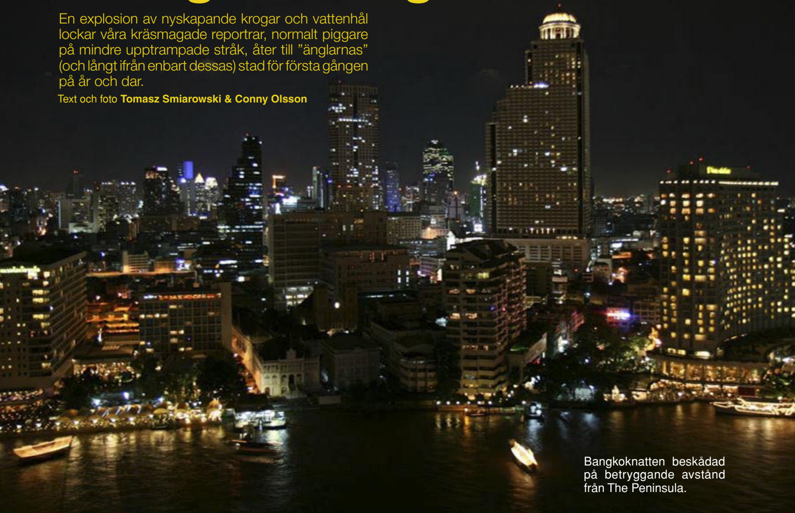
Bangkoknatten beskådad på betryggande avstånd från The Peninsula.