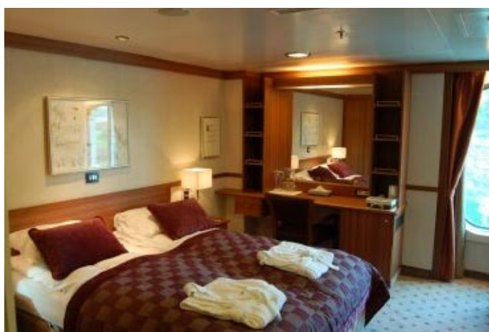
Fram har ett brett urval av boende från stora sviter med balkong till insideshytter. Tv en av fartygets minisviter.

därför gå in i de flesta fjordar och till nästan alla städer och samhällen längs Grönlandskusten.