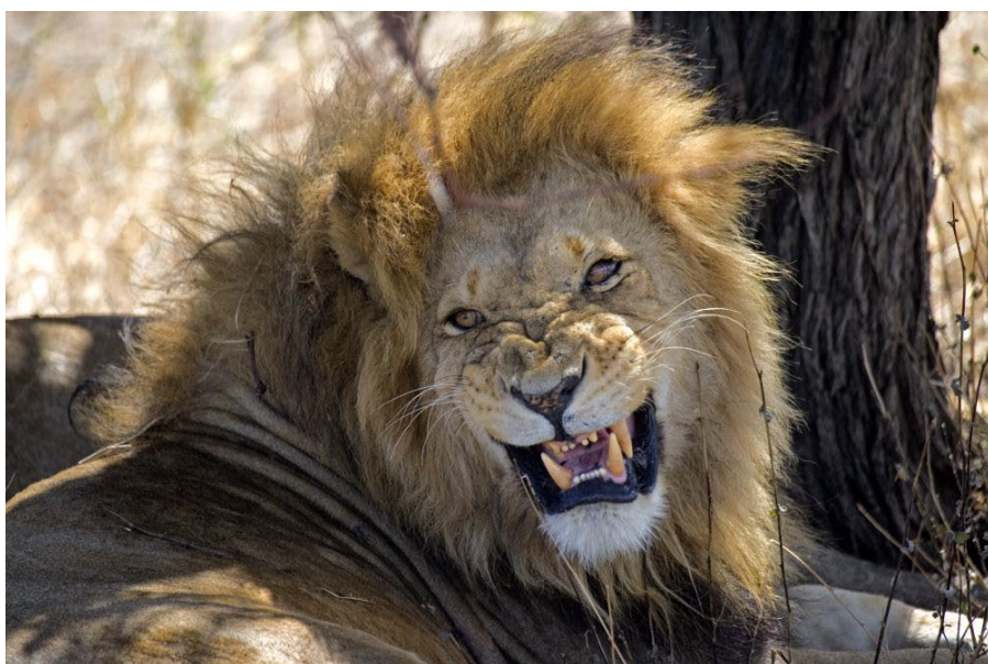
I hovdjurens spår frodas rovdjuren, här en präktig lejonkung.