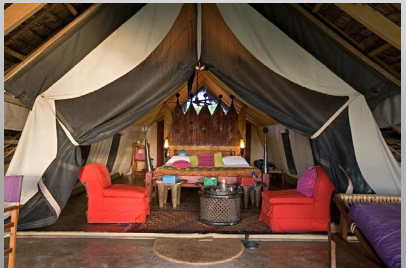
En bungalow och booman vid Lake Manyara Treetop Lodge. Ovan. En av de fasta tältbungalowerna i Grumeti River Camp. Höger. Thomsongasellernas konturer löses nästan upp i morgondimman i Serengeti.