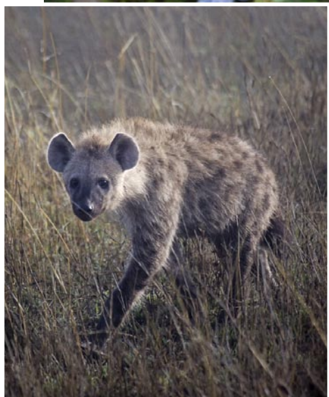
Uppifrån: Fältduschen laddas i ett av tälten på Prince Charles Camp.; En kall öl till picniclunchen heter förstas Serengeti och har en leopard som ikon; Hyena i grässavannens morgondagg.