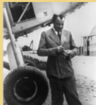
Antoine de Saint-Exupéry.

Saint-Exupérys böcker har utkommit på svenska i flera upplagor, bland annat som pocket.